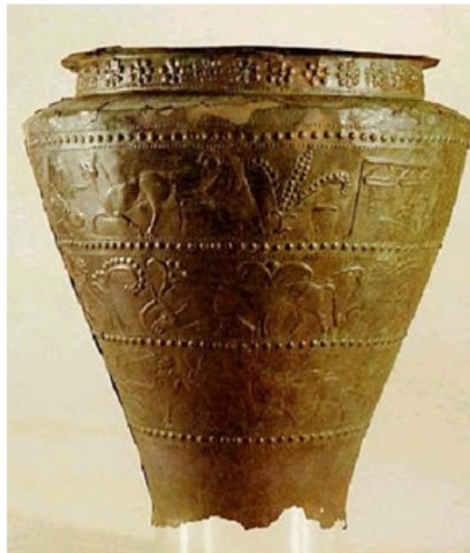
Slika: 7 Vaška situla