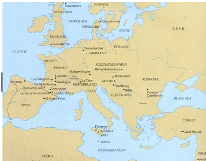
Slika: 3 Zemljevid prikazuje najbolj znani odkritji jamskih slikarij - jami Lascaux in Altamira

Poleg jame Altamira pa je znana tudi jama Lascaux (izg. Lazko) v jugozahodni Franciji.