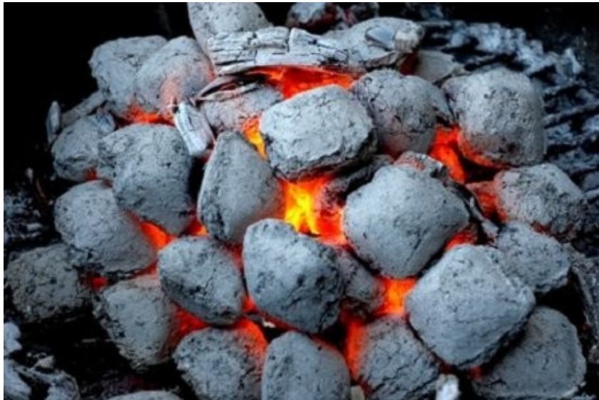
Slika: 13 Glavno sredstvo za risanje v prazgodovini je bilo oglje.

Še enkrat hvala vsem, ki ste si vzeli čas in prebrali nekaj o začetkih umetnosti v prazgodovini.