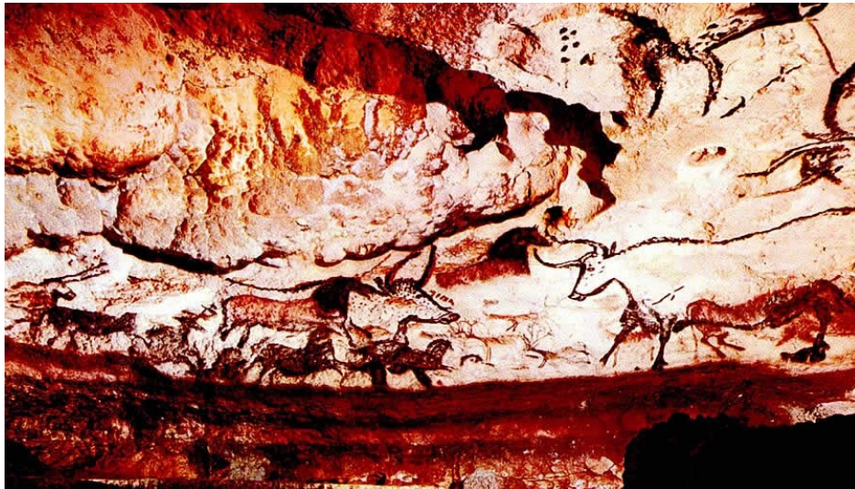
Slika: 5 Živalski friz iz Lascauxa, star 25.000 let