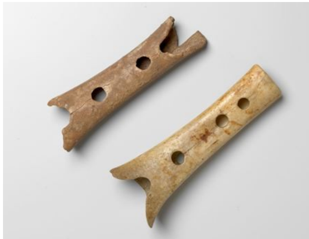
Slika: 12 Piščal, ki so jo arheologi našli v jami Divje babe nad Idrijco pri Cerknem

Najbolj poznano paleolitsko najdišče v Sloveniji je Potočka zijalka na severu države, na višini 1700 metrov. Jamski lovci so se zadrževali v njej pred 40.000 – 30.000 leti. Odkrili so jo leta 1928, med osemletnimi raziskavami pa je prišlo na dan okoli 300 kamnitih orodij, klinov, bodal, praskal, itd. in več kot 130 koščenin konic ali igel, ki so po številu in kakovosti izdelave edinstvena zbirka tovrstnega orodja v Evropi. Tudi v tem najdišču so našli piščal (narejeno iz čeljusti jamskega medveda). Po v kamen vpraskanih okraskih naj bi se tukaj začela tudi zgodovina likovne umetnosti na Slovenskem.