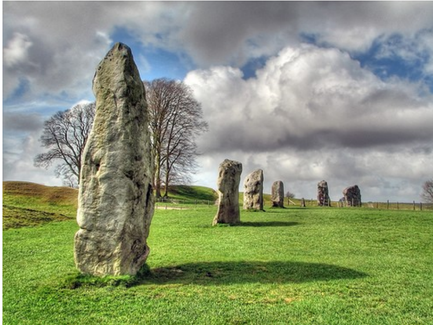
Slika: 8 Avebury v Veliki Britaniji

Megalitski spomeniki so bili grajeni s tehniko zarezovanja s klini in zagozdami.