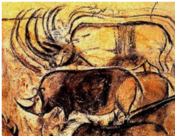
Slika 1: Lovski prizori – primeri realistične upodobitve