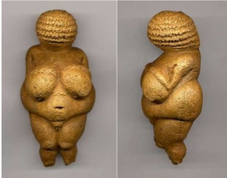
Slika: 6 Willendorfska Venera