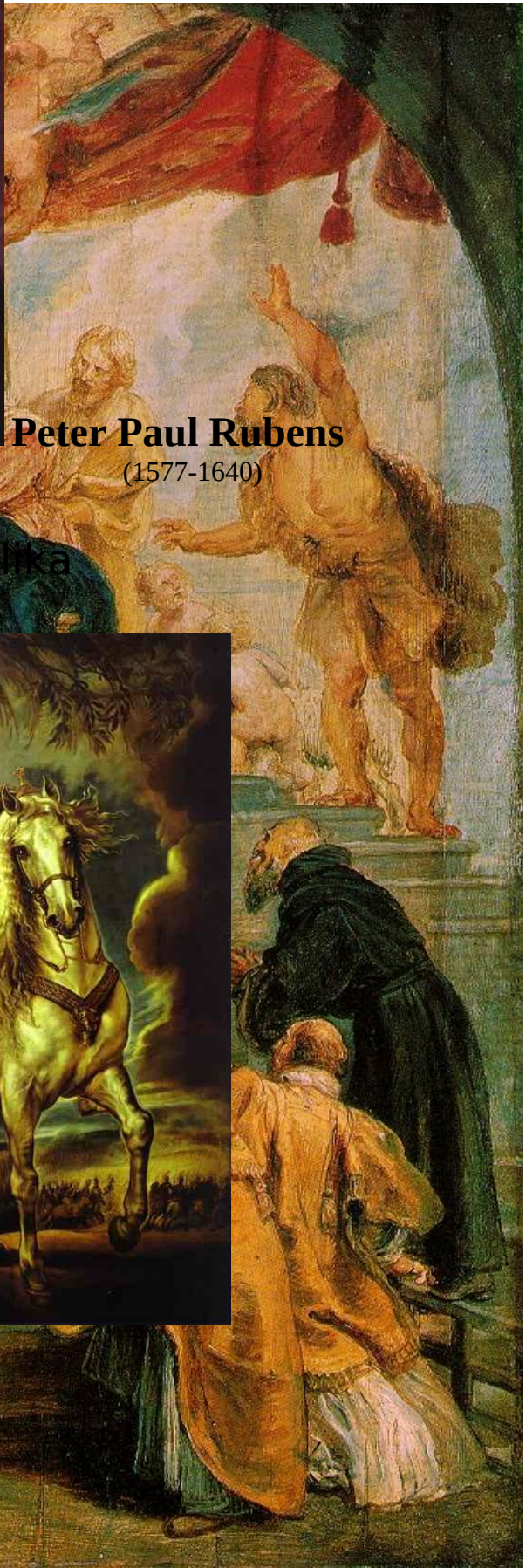
Peter Paul Rubens (1577-1640)