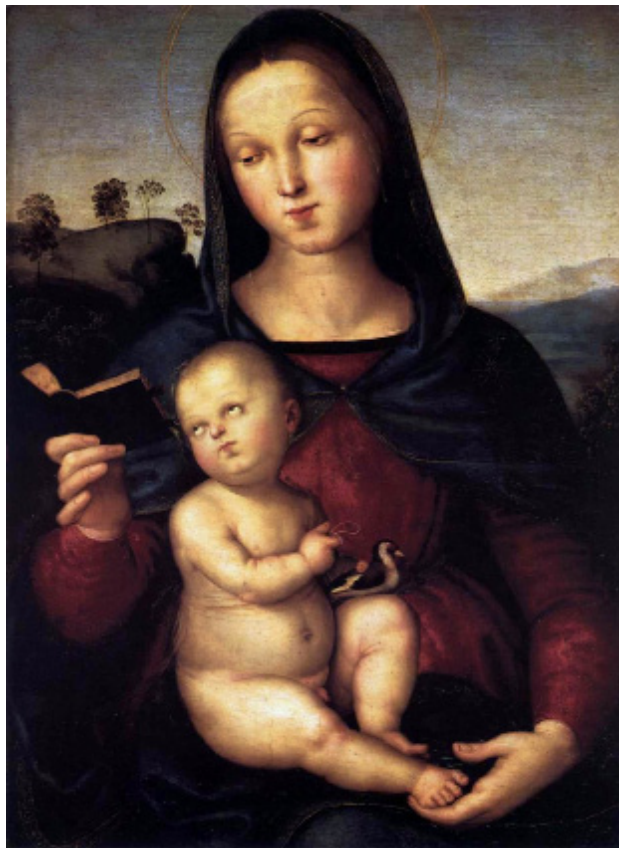
Sollyjeva Madona 1501, olje na les

Poleg te slike je v njegovem zgodnjem obdobju nastalo veliko Marijinih doprsnih podob,, saj je izredno rad risal ženske portrete