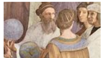
Zoroaster , Ptolemej , Raphael kot Apel in Perugino ali Timoteo Viti kot Protogenes