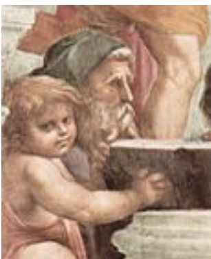
Zenon iz Kitija