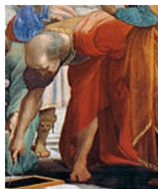
Bramante kot Evklid ali Arhimed