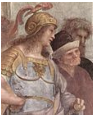
Aleksander Veliki in Antisthenes