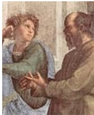
Aeschines in Sokrat