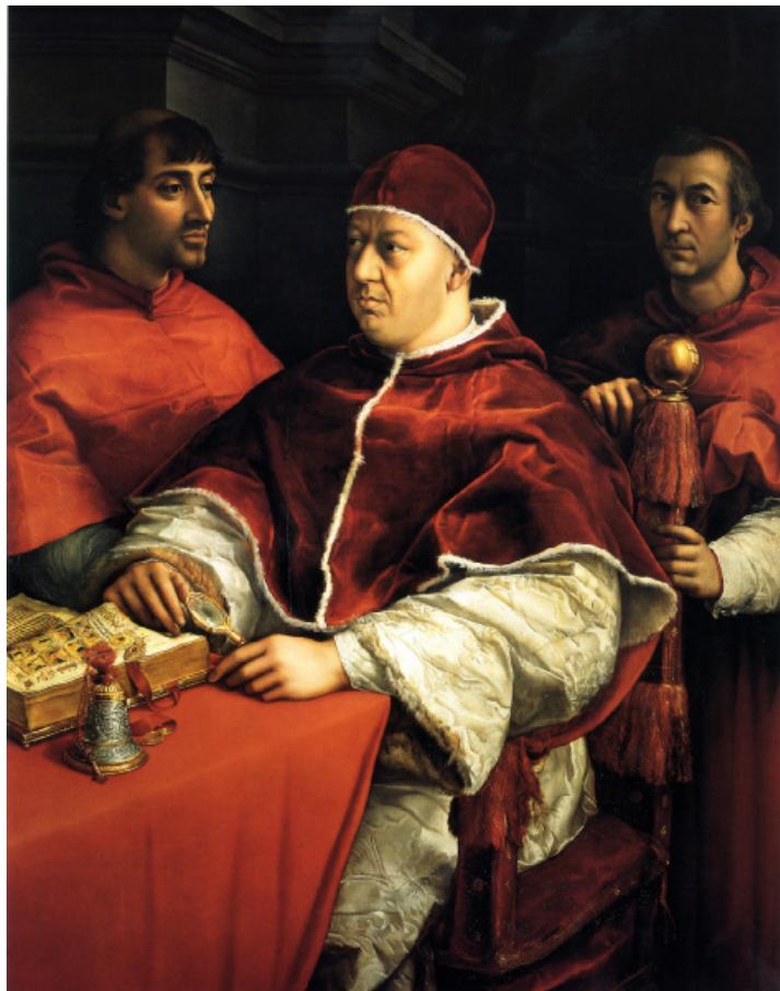
Papež Leo X. 1518-19, olje na les

V zadnjih letih pa je njegovo slikanje podob spet doživelo spremembo, realistični stil je popustil za reprezentativni prikaz (primera: Portret žene s pajčolanom –1512/13 in Baldassare Castiglione –1514/15) Najpomembnejši Raffaellov portret iz njegovega poznega obdobja pa je portret Leon X (1517/18), na katerem je upodobljen papež Leona X, ob njem pa kardinala Luigi de' Rossi in Giuliano de' Medici. Sam portret postane vzorčni tip slike za uradno papeževu upodobitev, za katero je obvezen sedeči položaj in prikaz v tričetrtinski postavi. V letih 1519/20 je Raffael, po naročilu Giulio de' Medica, narisal zadnje delo, ki ga je narisal pretežno sam, to je monumentalna slika Spreminjanje na gori. V stopnjevanju kontrastov, prostorska razporeditev in drzna barvitost in v razgibanosti se vidi, da se je tedaj že poslovil od umirjene kompozicijske renesanse in odprl pot novi smeri manierizmu.