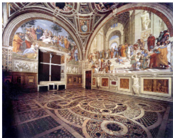
Stanza della Segnatura

Na stenski poslikavi, ki meri malo manj kot osem metrov, je Rafael upodobil Platona v podobi Leonarda da Vinci in Aristotela v središču kompozicije. Mnogi misleci antike so namreč v podobi prevzeli kar obraz Rafaelovih sodobnikov. Na stopnišču pred arhitekturo lahko tudi s pomočjo atributov prepoznamo Pitagoro, Sokrata, Parmenida.