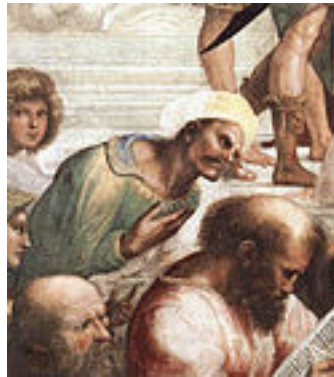
Averroes in Pitagora