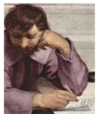
Michelangelo kot Heraklit