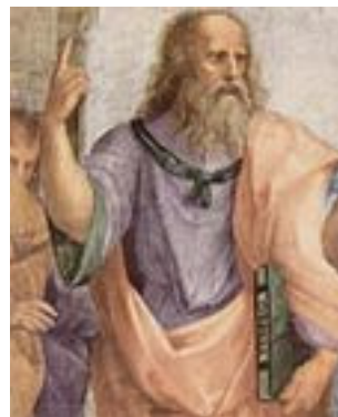
Leonardo da Vinci kot Platon