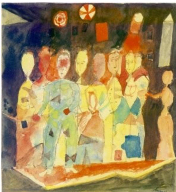
Manifestanti, 1958, akvarel, 22,6 × 18,4 cm