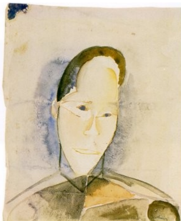
Portretna študija, 1958, 25,8 × 21 cm