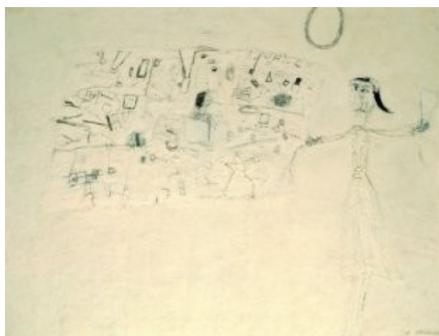
Deklica z igračami, 1967, olje, les, 129 × 169 cm