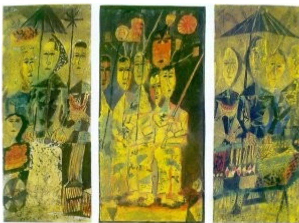
risbe akvareli in tempere