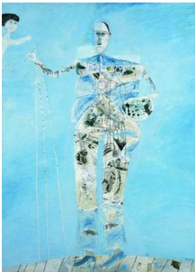
Veliki svetli avtoportret, 1959