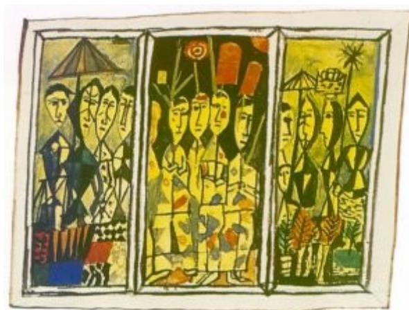
Osnutek za triptih: prodajalke, manifestacije, 1958, akvarel, 12,3 × 25,4 cm