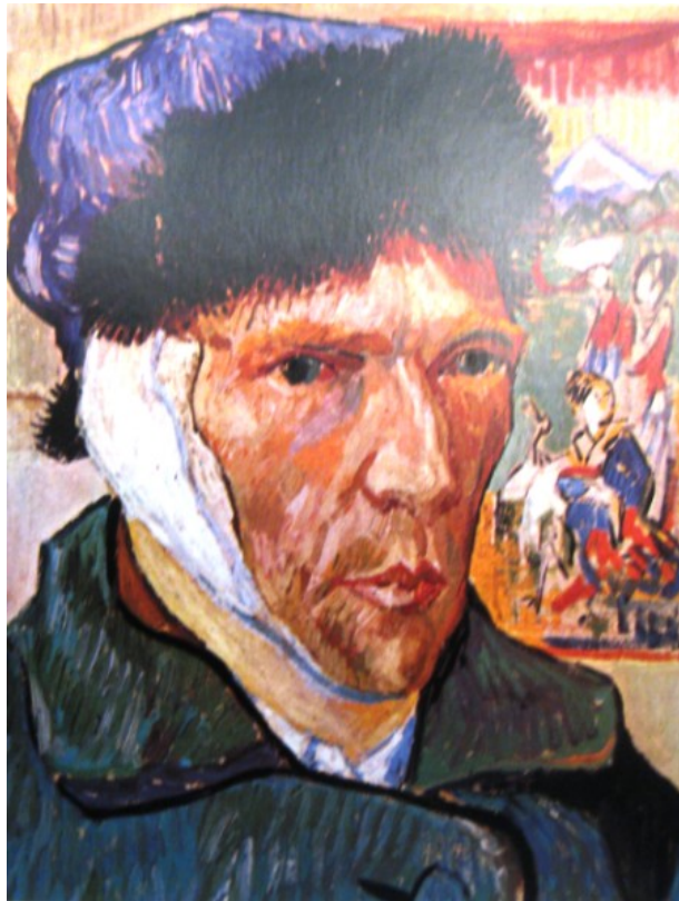
Slika 4: Avtopoteret z obvezanim ušesom