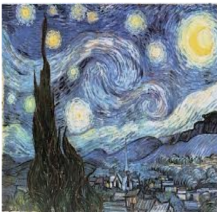
Slika 7: Zvezdna noč

Slika nočnega neba je bila narejena v St-Remy-de-Provence. Slutimo, kako njene vznemirljiva veličastnost in vrtinčasta bleščava zvezd odsevata Van Goghove občutke, da je le orodje v ustvarjalnem procesu veselja. V pismu Theu je zapisal: »Večno vprašanje je, ali je to, da živimo vse kar imamo od življenja pred smrtjo ali morda ne spoznamo le polovice? Jaz osebno ne vem odgovora, vendar me pogled na zvezde vedno spodbudi k razmišljanju«.