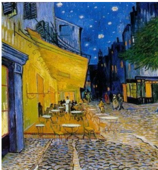
Slika 6: Kavarna ponoči, trg Forum v Arlesu

To je ena umetnikovih najmočnejših slik kavarne, v katero sta zahajala z Gauguinom. Van Gogha je navdušila zamisel, da bi slikal ponoči – kavarna s svojimi rumenimi lučmi nasproti nočnemu nebu je bila primerna tema. Limonasto rumena barva platnene strehe se razliva po spodnjem delu slike in spremeni v oranžno, ki je v kontrastu s steno in z miznimi ploščami v dveh tonih zelene. Van Gogh je uporabljal impresionistične ideje o barvi, vendar na način, ki je vodil k fauvistom in Matisu.