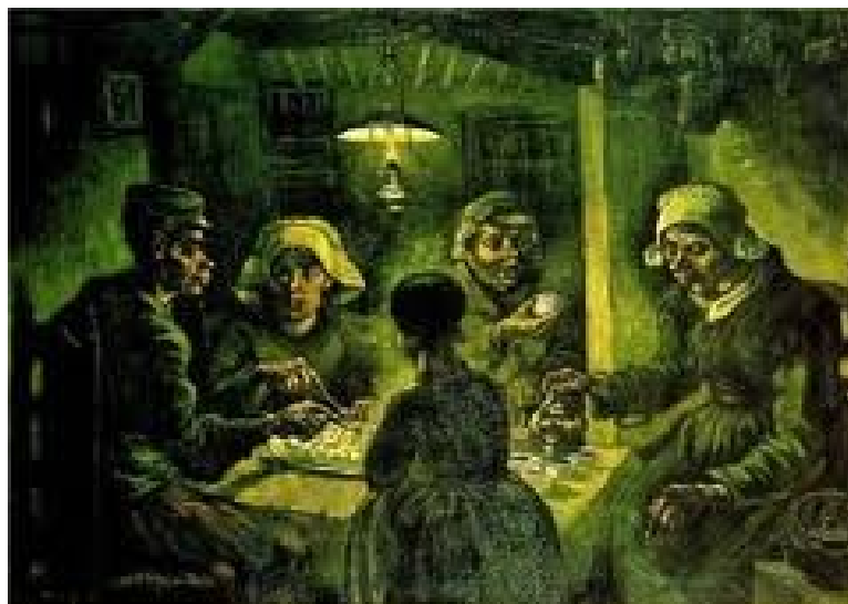
Slika 5: Jedci krompirja

Večina del, ki jih je Van Gogh ustvaril na Holandskem pred odhodom v Pariz je temnih in težkih. V njih zasledimo njegovo sočustvovanje z revnimi, zapostavljenimi rudarji in kmečkimi delavci. Izražajo tudi njegovo globoko versko usmiljenje do teh ljudi in upanje, da njihovo mukotrpno delo ni bilo zaman. V njegovem pismu bratu Theu je izražena »ideja, da so ti ljudje v soju svetilke obdelovali zemljo.« leta 1885 je naredil več različic teme Jedci krompirja .