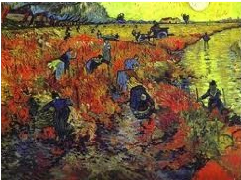
Slika 8: Rdeči vinograd v Arlesu