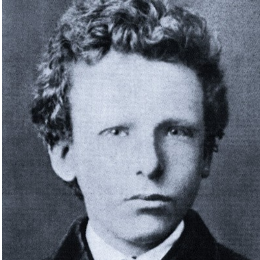
Slika 2: Vincent van Gogh v mladih letih

rezali pravilni kanali, v nekaterih se je zrcalilo sveže zelenje bregov in izpreminjajoča se modrina neba.