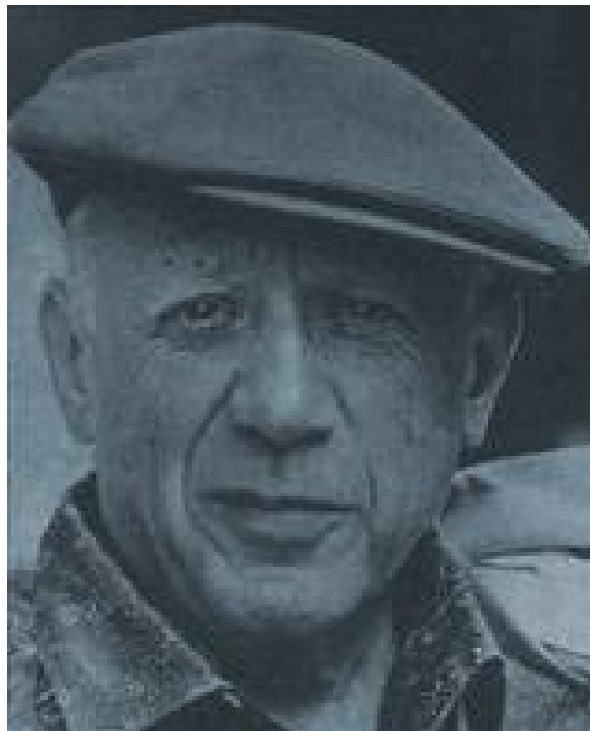
Slika 10: Pablo Picasso

Enajst let po njegovi smrti so njegove slike razstavili v Parizu in Van Gogh je čez noč postal slaven, pomemben in zelo iskan. Njegova doslej najdražja slika se je leta 1990 prodala za 82,5 milijona dolarjev. Višjo ceno je dosegel le Picasso.