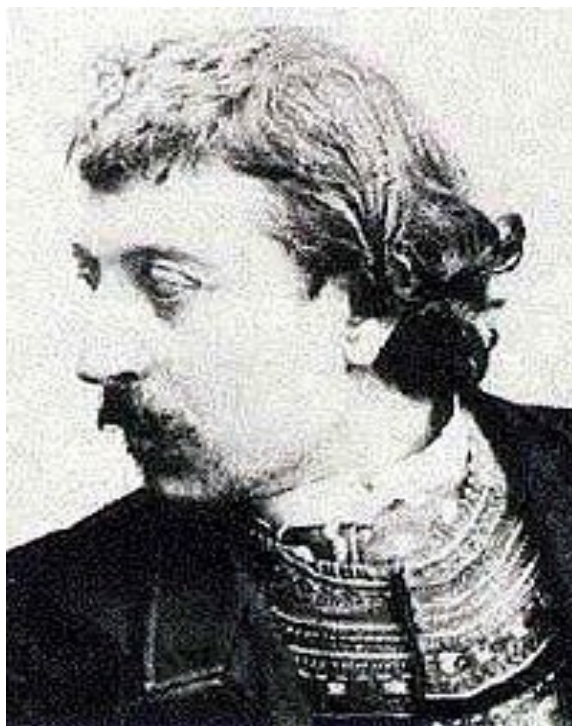
Slika 3: Paul Gauguin