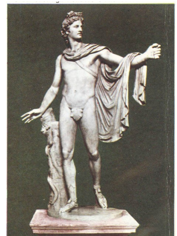
ROMA - Museo Vaticano Apollo Belvedere opera di Calamide contemporaneo di Prassitele