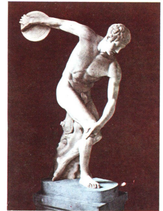
Museo Vaticano Sala della Biga Discobolo copia del celebre originale di Mirone