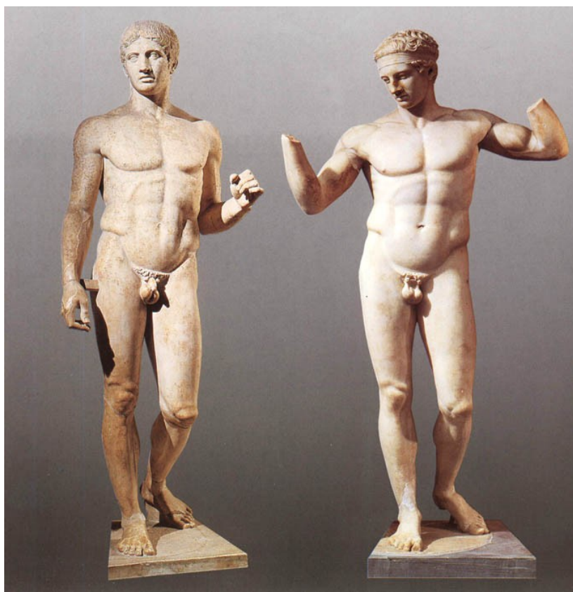
Praksitel: Kopjenosec (levo) in Diadumenos (desno)