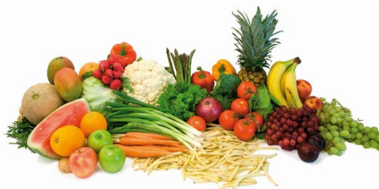
Slika 11: Različne vrste sadja in zelenjave

Sadje in zelenjava vsebujeta (poleg vitaminov in mineralov) veliko vlaknin. Ta hrana ne samo da je najlažja in odlično poteši lakoto, temveč tudi pomaga znižati holesterol ter ovira absorpcijo maščobe v telo.