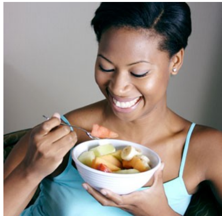
Slika 1: Primer zdravega prehranjevanja

Osnova pravilnega prehranjevanja je zagotovo prehrabena piramida, zato jo bom izpostavila že na začetku. Ker pa sem sama v obdobju odraščanja, se mi zdi prav, da se dotaknem tudi prehranskih navad najstnikov. Vsak posameznik ima pri prehranjevanju svoje navade, vendar vseeno obstajajo nekakšna priporočila, ki se jih je vredno držati. In ravno te sem predstavila tudi v seminarski nalogi. Lahko najdemo odgovor na vprašanje, zakaj je potrebno zajtrkovati ipd. V seminarski nalogi se nahaja tudi enačba, s katero lahko izračunamo svojo dnevno potrebo kalorij. Hrana je torej ključnega pomena pri kvaliteti življenja, počutja in športnih uspehov, s pravilno prehrano pa lahko izboljšamo, obnovimo in zaščitimo celotni organizem.