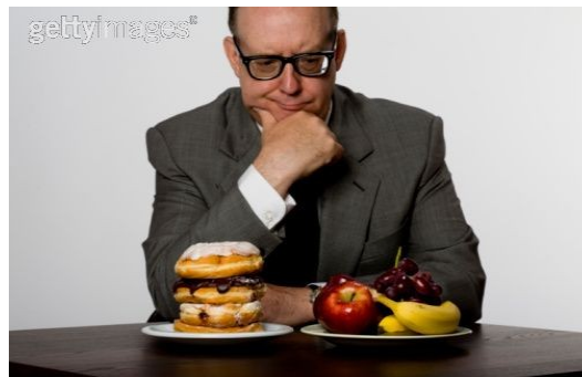
Slika 7: Spremeniti prehranjevalne navade ali ne?