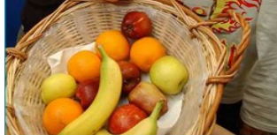
Slika 8: Najstniki in sadje