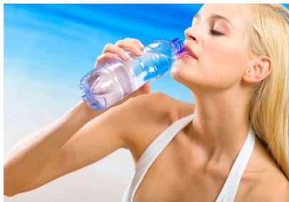
Slika 10: Pitje vode

Voda je najboljša tekočina. Približno 70% človeškega telesa je voda. Zato je najbolje, da pijemo ravno to, kar je največji del sestave našega telesa. Glavnina vode zapusti naše telo preko ledvic z urinom (1500 ml), preko kože s potenjem jo izgubimo okoli 1000 ml in približno 200 ml z blatom. Da bi vzdrževali dnevno bilanco vode, potrebujemo med 2000 ml in 2500 ml tekočine. S hrano jo povprečno vnesemo vsak dan 1000 ml, pri metabolizmu nastane dodatnih 250 ml vode, preostanek 1500 – 2000 ml pa jo moramo dnevno v telo vnesti s pijačo, najbolje pitno vodo. Seveda so to le povprečni izračuni za odraslega človeka. Pitje vsake ostale tekočine se kasneje absorbira v telesni sistem in je zato za naše telo težje ter počutje slabše. Seveda je priporočljivo pitje zeliščnih čajev in podobnih pijač, ki jih pripravimo iz vode.