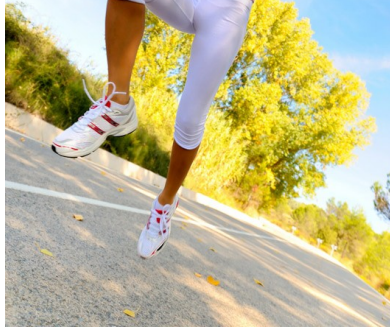
Slika 16: Tek v naravi je ena boljših vrst gibanja, ki skupaj z zdravo prehrano omogoča vzdrževanje stalne telesne teže.