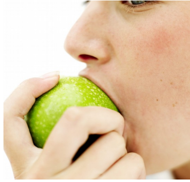
Slika 13: Ustrezna malica

Kosilo predstavlja osrednji dnevni obrok, ki naj bo sestavljen pestro iz vseh skupin živil. Ko imamo ves dan nabit z obveznostmi, aktivnostmi in opravki, sta kosilo in popoldanska malica na dnu naše liste opravkov. Toda, če ju preskočimo to lahko pomeni pozno popoldansko uživanje čokolade, piškotov ali čipsa, saj je naša volja šibkejša kot bi bila, če bi jedli normalno. Tako pojemo še več, kot če bi jedli kosilo. Ali pa na račun izpuščenega kosila in popoldanske malice pojemo več za večerjo kot bi sicer.