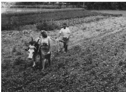
Slika 2: Delo na polju nekoč

Danes pa se kljub vsemu daje vse večji poudarek na zdravo in uravnoteženo prehrano, saj je tudi zaradi spremembe le te prišlo do mnogih bolezni. Zato smo se ljudje začeli zavedati pomena pravilne prehrane in skušamo to ozaveščenost prenesti tudi na naslednje rodove.