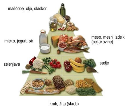
Slika 6: Prehranska piramida