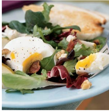
Slika 15: Večerja