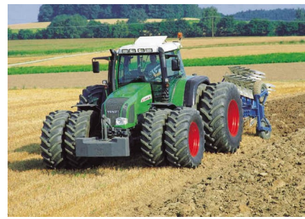
Slika 3: Delo na polju danes