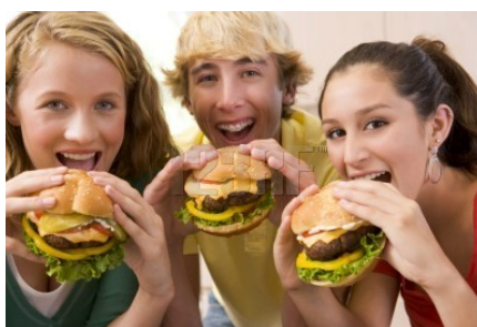
Slika 9: Primer nezdravega prehranjevanja mladih