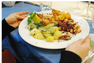
Slika 14: Primer kosila

Kosilo predstavlja osrednji dnevni obrok, ki naj bo sestavljen pestro iz vseh skupin živil. Ko imamo ves dan nabit z obveznostmi, aktivnostmi in opravki, sta kosilo in popoldanska malica na dnu naše liste opravkov. Toda, če ju preskočimo to lahko pomeni pozno popoldansko uživanje čokolade, piškotov ali čipsa, saj je naša volja šibkejša kot bi bila, če bi jedli normalno. Tako pojemo še več, kot če bi jedli kosilo. Ali pa na račun izpuščenega kosila in popoldanske malice pojemo več za večerjo kot bi sicer.