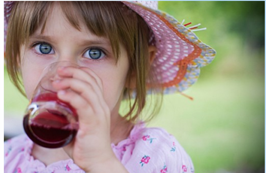
PITJE SLADKIH SOKOV