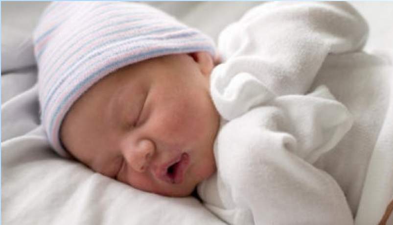
DIHANJE SKOZI USTA