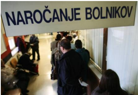
Slika 5: Čakalne vrste v ambulantah

minut v čakalnici. Kako se izogniti čakalni vrsti? Naročijo se pri zasebnih zdravnikih, pri katerih je čakalna doba zelo kratka ali pa je sploh ni.