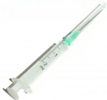
Slika 3: Inekcija (delovni pripomoček)

Izvaja se celovita bolnišnična in ambulantna-specialistična zdravstvena oskrba na sekundarni ravni organiziranja zdravstvene dejavnosti za prebivalce celotne regije.