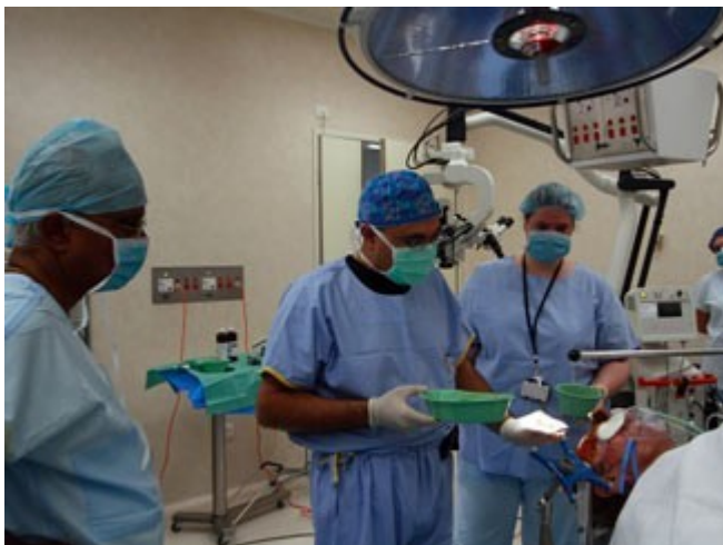
Slika 4: Osebe v zdravstvu