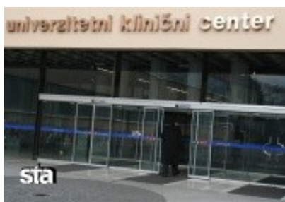
Slika 1: UKC-Univerzitetni klinični center

13. julija 1966 se je pričela gradnja osrednje stavbe Kliničnega centra. Prvotni načrt je predvideval gradnjo stolpnice z devetnajstimi nadstropji in 896 bolniškimi posteljami. Načrte so večkrat spreminjali, končno pa so se odločili za osem etažni objekt, v katerem je bilo urejenih 1.100 bolniških postelj. Postopoma so jih od leta 1970 začeli zasedati bolniki, premeščeni z nekaterih oddelkov Kliničnih bolnic. Gradnja osrednje stavbe Kliničnega centra je trajala skoraj 10 let, slovesna otvoritev Kliničnega centra pa je bila 29. novembra 1975.