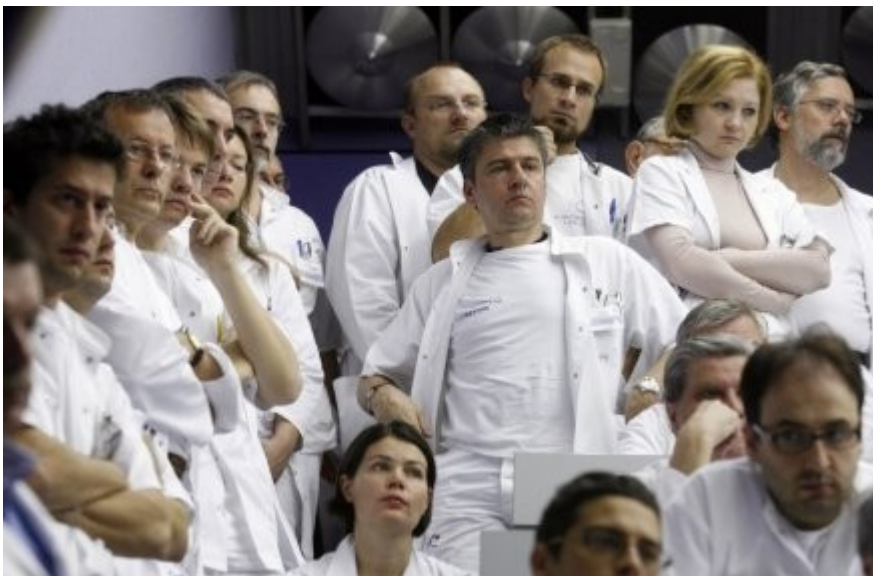
Slika 6: Stavke zdravniškega osebja

Glavna razloga za stavko sta neprimerno plačilo in prekomerne obremenitve. Z višjo plačo se seveda obremenitve zdravnikov ne bodo zmanjšale, bodo pa boljši prihodki zaustavili ali vsaj zavrli odhajanje zdravnikov iz bolnišnic in zdravstvenih domov v zasebništvu ali tujino.