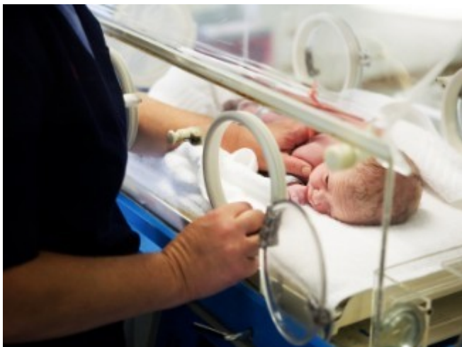
Slika 2: Novorojenček