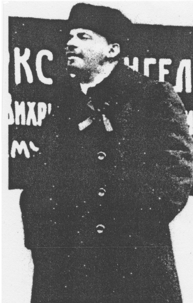
Immagine 1: Lenin