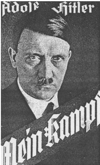
Immagine 3: Adolf Hitler