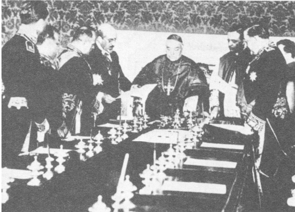
Immagine 2: Sottoscrizione dei Patti Lateranensi