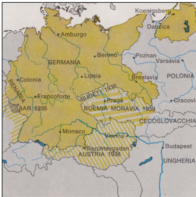
Cartina 1: Espansione della Germania sino alla seconda guerra mondiale

(Fonte: Capra, C., 1987: Il libro Garzanti della storia , vol. III, pag. 319, Garzanti, Milano.)