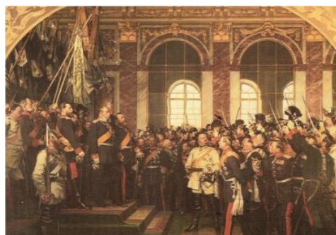
Figura 3: La proclamazione dell'Impero