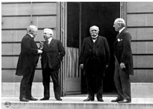
Figura 8: «I Quattro grandi» che alla conferenza di Parigi definirono l'assetto mondiale dopo la grande guerra