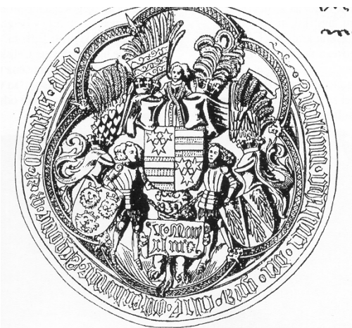
Immagine 1: Sigillo di Ulrico II