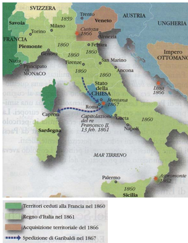
Figura 10: La III guerra d'indipendenza italiana

(Fonte: Trombino, M., Villani, M., 2008: Storiaindo 2, p. 413. il capitulo. Torino)