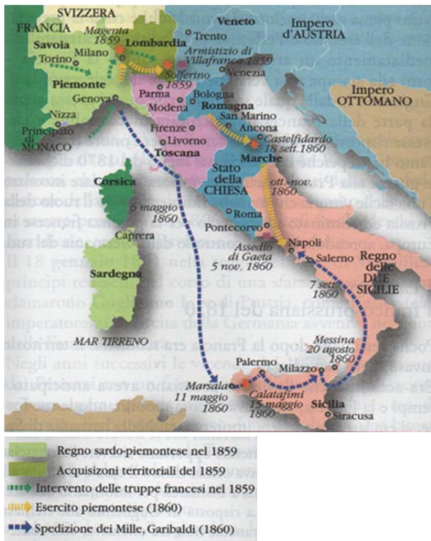
Figura 9: La II guerra d'indipendenza italiana

Non scrivete nel campo grigio. Non scrivete nel campo grigio. Non scrivete nel campo grigio. Non scrivete nel campo grigio. Non scrivete nel campo grigio.