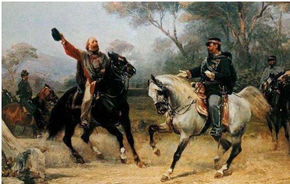
Figura 4: Incontro tra Garibaldi e Vittorio Emanuele II

Rispondete alle domande aiutandovi con la figura 4 e la figura 11 dell'allegato a colori.