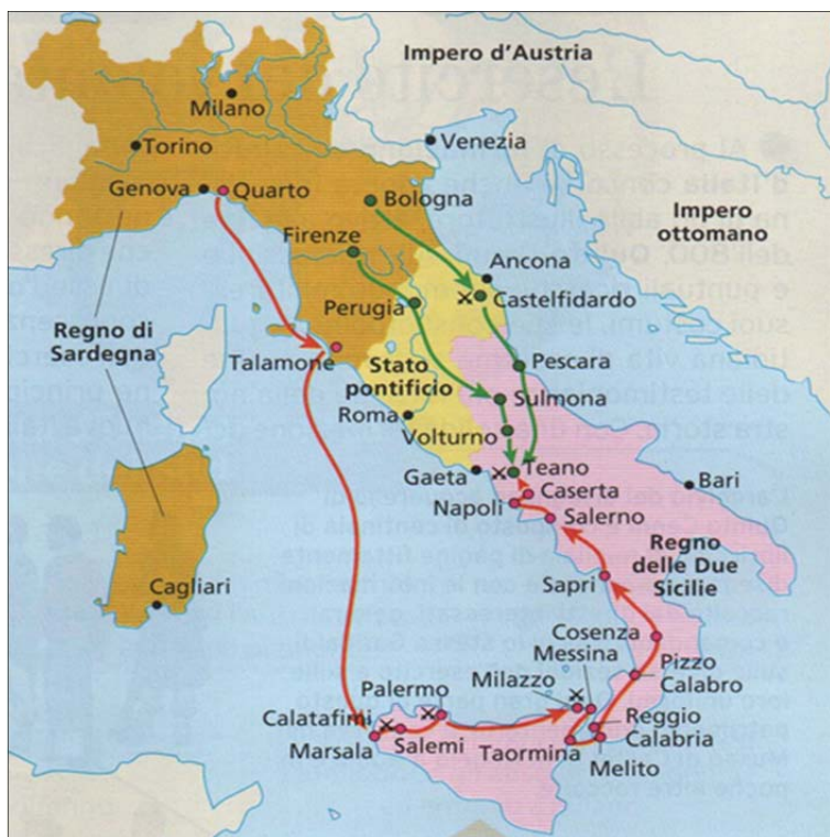
Figura 11: Percorso di Garibaldi