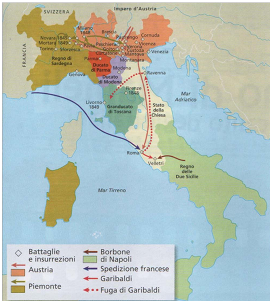
Figura 8: La I guerra d'indipendenza italiana