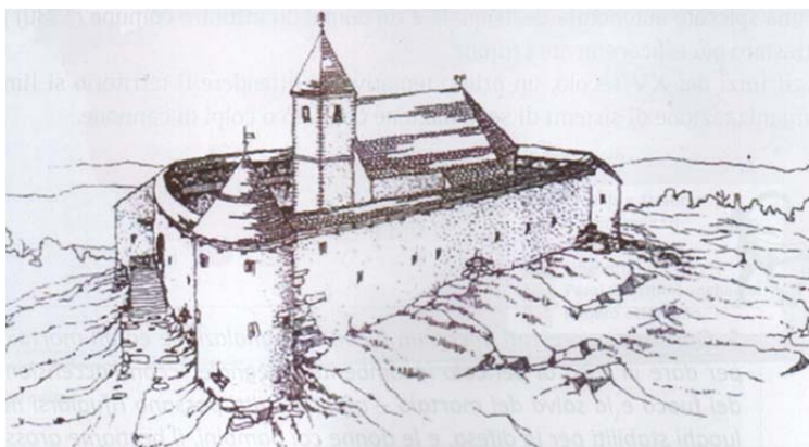
Figura 2: Fortificazione contadina