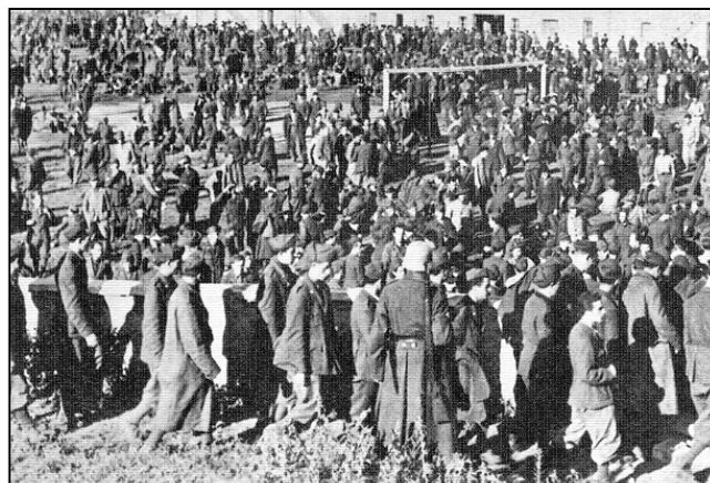
Foto 4: Civili e soldati italiani concentrati in un campo sportivo a Bolzano