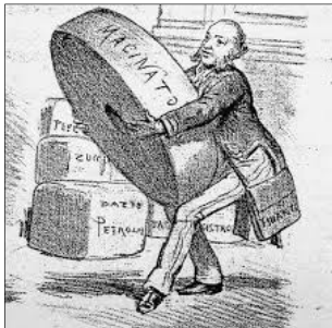
Figura 5: La tassa sul macinato

23. Nel 1876 finì l'era della Destra storica e iniziò il governo della Sinistra storica.