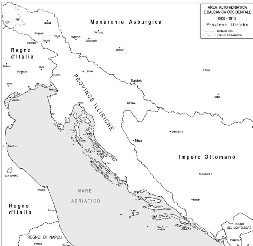
Figura 10: Il territorio delle Province illiriche