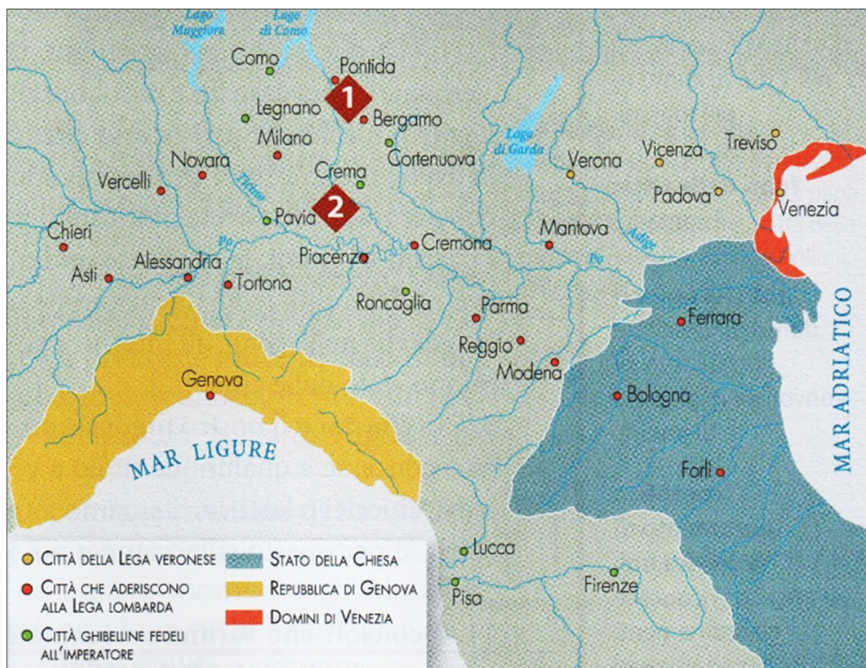
Figura 8: Schieramenti dei comuni italiani (Fonte: Brancati, A., Pagliarini, T., 2020: La storia in 100 lezioni, p. 71. Rizzoli. Milano)