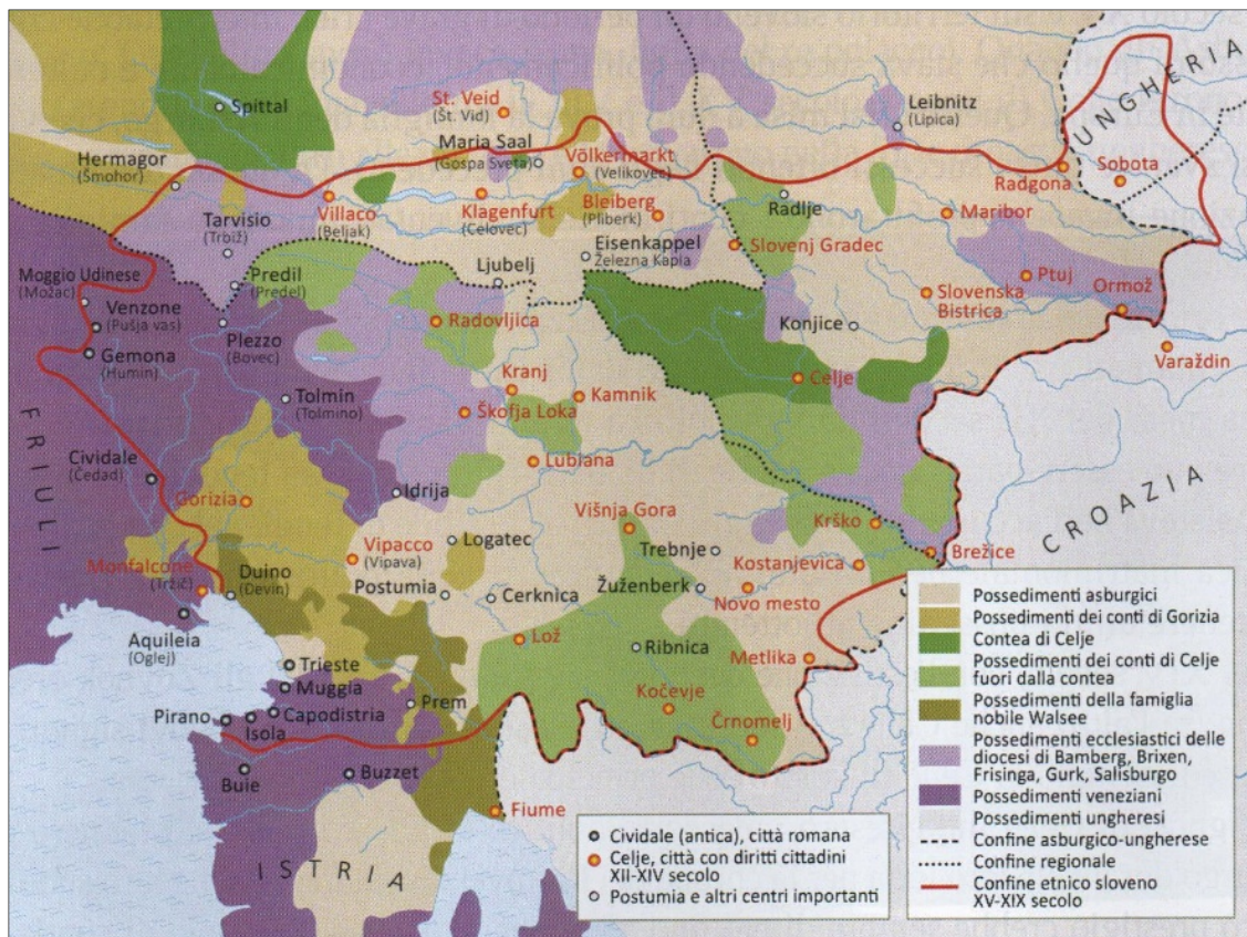
Figura 7: I possedimenti feudali più importanti (Fonte: Burra, A. et al., 2018: Storia degli sloveni, p. 33, ZRSŠ. Lubiana)