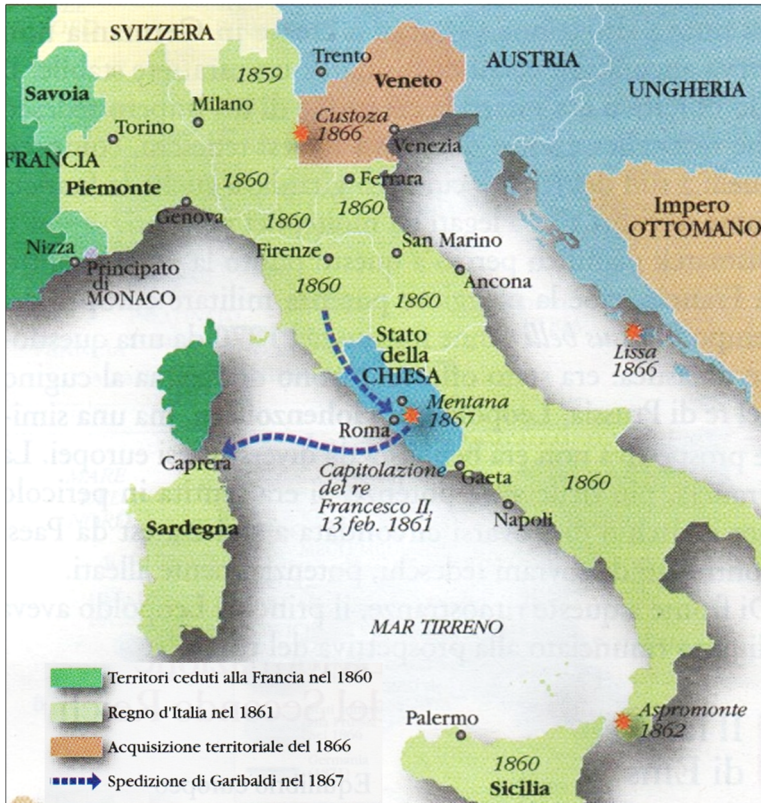
Figura 9: L'Italia dopo l'unificazione

Non scrivete nel campo grigio. Non scrivete nel campo grigio. Non scrivete nel campo grigio. Non scrivete nel campo grigio. Non scrivete nel campo grigio.