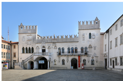
Figura 2: Palazzo Pretorio

13. Le città medievali slovene si dividono in quelle continentali e quelle del Litorale.