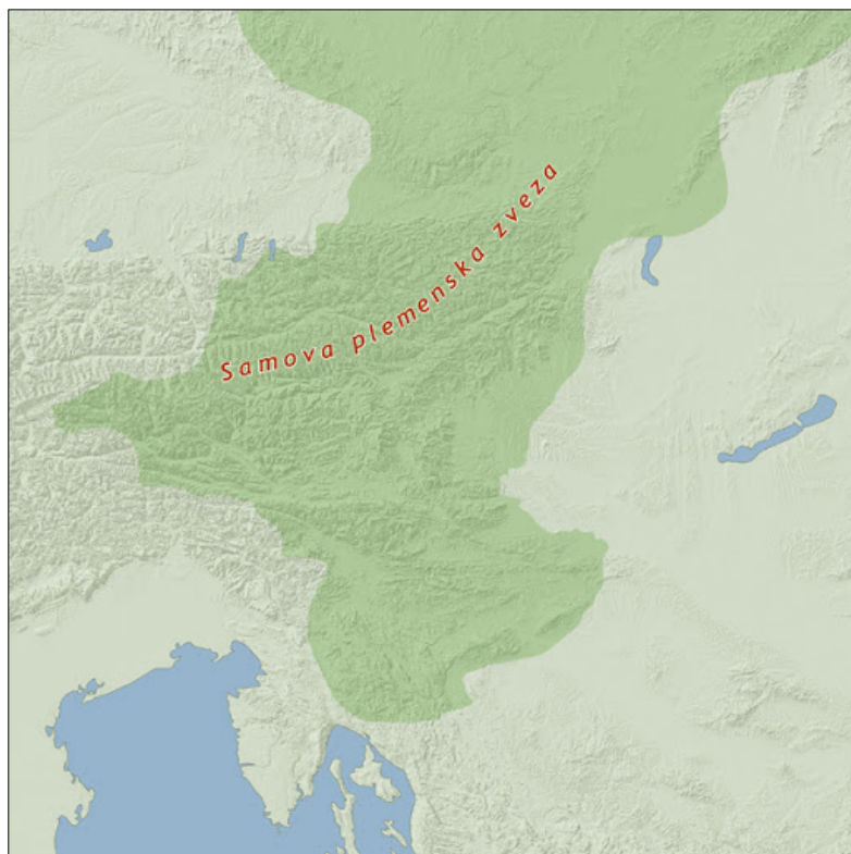
Figura 6: Lega di Samo