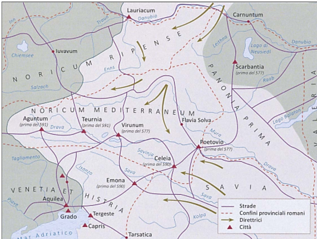
Figura 5: Arrivo degli Slavi nelle Alpi orientali

(Fonte: http://www.savel-hobi.net/leksikon/zgodovina_sl/rimskadoba.htm . Data di consultazione: 16. 5. 2021.)