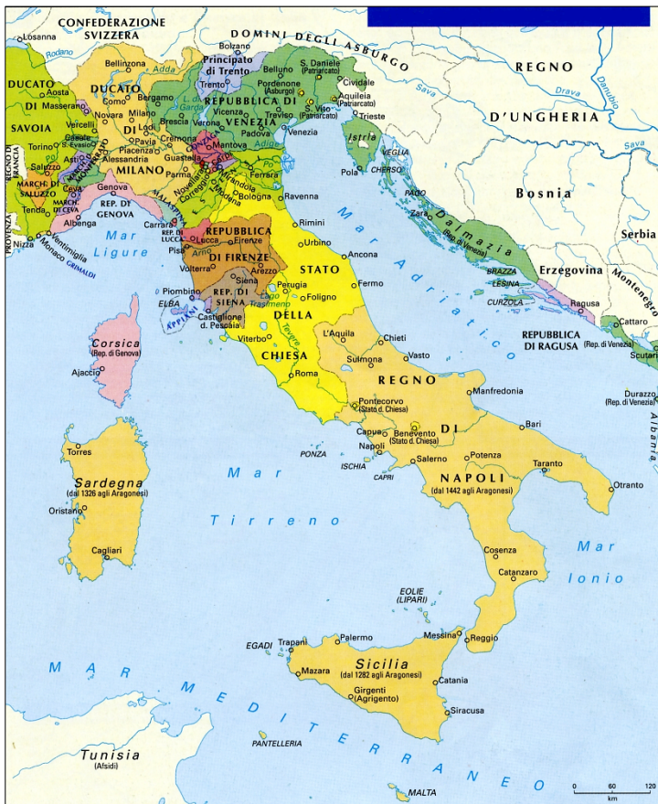
Figura 11: L'Italia nella seconda metà del Quattrocento