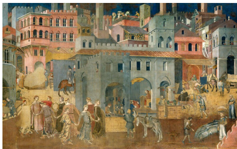
Figura 3: Comune italiano

19. Il passaggio dal comune alla signoria fu un momento cruciale nella storia dell'Italia centro-settentrionale.