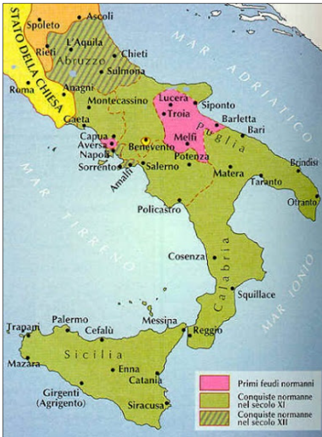
Figura 9: Possedimenti normanni in Italia

(Fonte: Camera, F., et al., 1997: Storia 1, p. XXII. Zanichelli. Bologna)