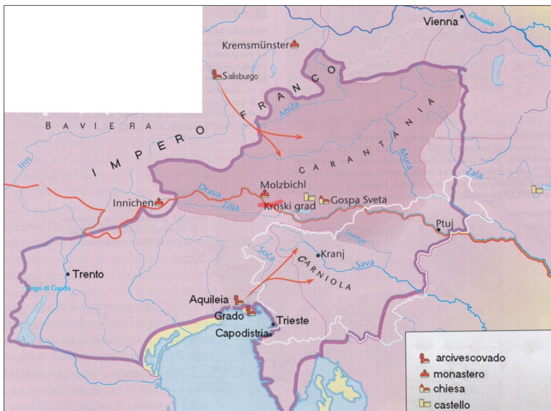
Figura 7: Le nostre regioni intorno all'anno 828