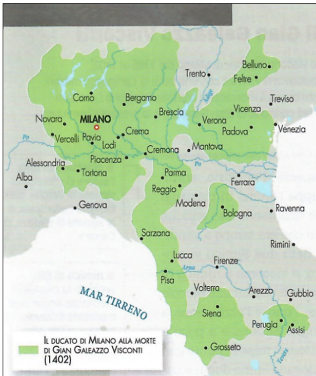
Figura 10: L'espansione del Ducato di Milano fino al 1402 (Fonte: Brancati. A., 2019: Storia in movimento 1, p. 202. Rizzoli, Milano)