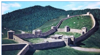
Figura 1: Sistema difensivo

3. Sul territorio dell'attuale Slovenia, i Romani costruirono anche un sistema difensivo.