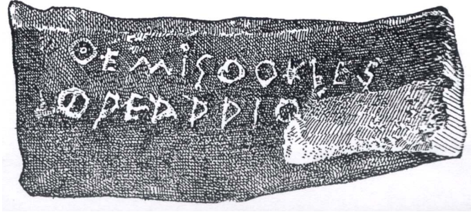
(Vir: Tukidides, 1958: Peloponeška vojna, str. 79. DZS. Ljubljana)