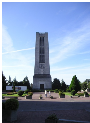
Slika 7 / 7. sz. kép: Eden od spomenikov žrtev v bitkah pri Verdunu