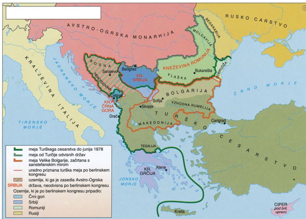
Slika 3 / 3. sz. kép: Balkan po berlinskem kongresu