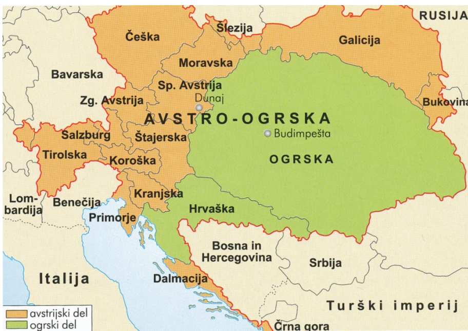
Slika 5 / 5. sz. kép