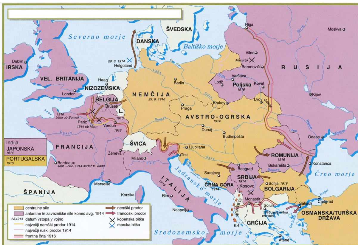
Slika 6 / 6. sz. k ep: Prva svetovna vojna v letih 1914–1916

(Vir: Zgodovinski atlas za osnovno  olo, str. 35. DZS. Ljubljana, 1999)