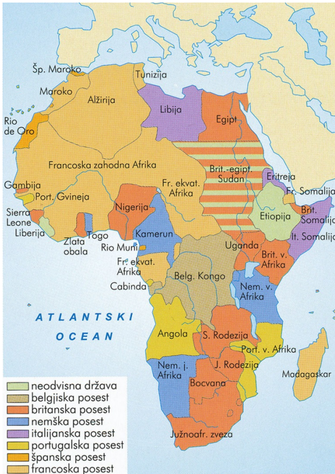
Slika 4 / 4. sz. kép: Posest v Afriki pred letom 1914