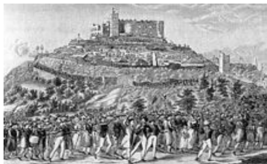
Slika 2 / 2. sz. kép: Shod na gradu Hambach