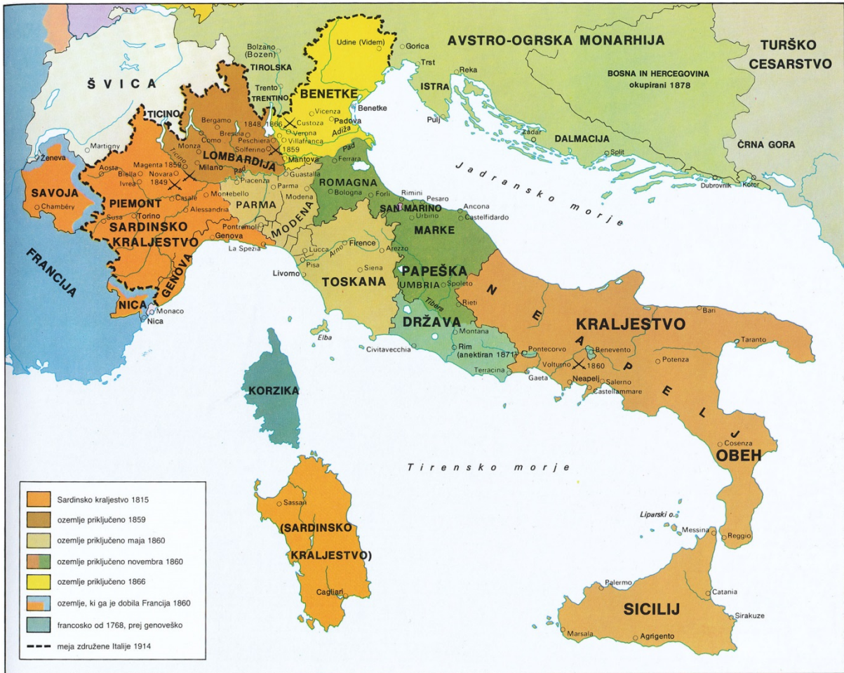
Slika 1 / 1. sz. kép