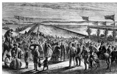
Slika 4 / 4. sz. kép: Slovesno odprtje v Port Saidu

(Vir: http://sl.wikipedia.org/wiki/ . Pridobljeno: 12. 2. 2013.)