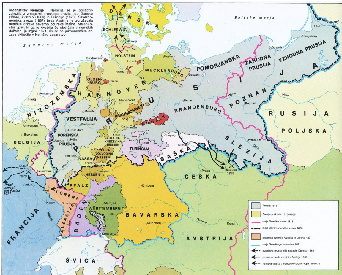
Slika 2 / 2. sz. kép