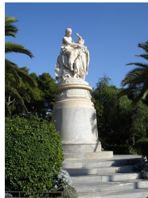
Slika 5 / 5. sz. kép: Spomenik podpornikov grške vstaje v Atenah