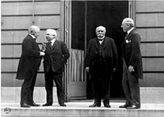
Slika 8 / 8. sz. kép: »Veliki štirje«, ki so na pariški mirovni konferenci krojili usodo sveta po prvi svetovni vojni

A harcok befejeztével 1919 januárjában Párizsban megkezdődött a békekonferencia, amelynek békét kellett volna hoznia, valamint rendezni az európai államok közti viszonyt. A konferenciára nem voltak hivatalosak sem a vesztesek, sem Oroszország. Ez utóbbi a bolsevista forradalom miatt Európában félelmet keltett a forradalmi zavargásoktól. A tárgyalások megteremtették az ún. „versailles-i Európát”.