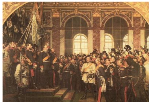
Slika 3 / 3. sz. kép: Slovesnost ob razglasitvi cesarja

Magyarázza meg az egyik nehézséget, amellyel szembesült az egyesített Németország!