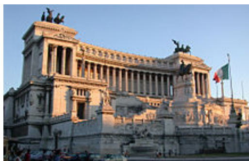
Slika 1 / 1. sz. kép: Spomenik zedinjenju Italije v Rimu

A színes melléklet 1. számú képének segítségével soroljon fel négy államot, amelyek az egyesítés előtt léteztek a mai Olaszország területén!