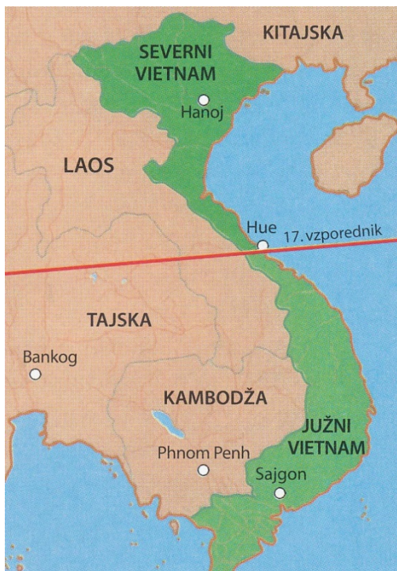
Slika 6 / 6. sz. kép: Vietnam