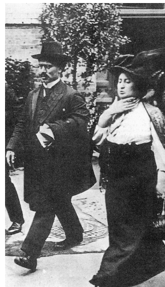
Slika 2 / 2. sz. kép: Rosa Luxemburg s sodelavcem Karlom Liebknechtom