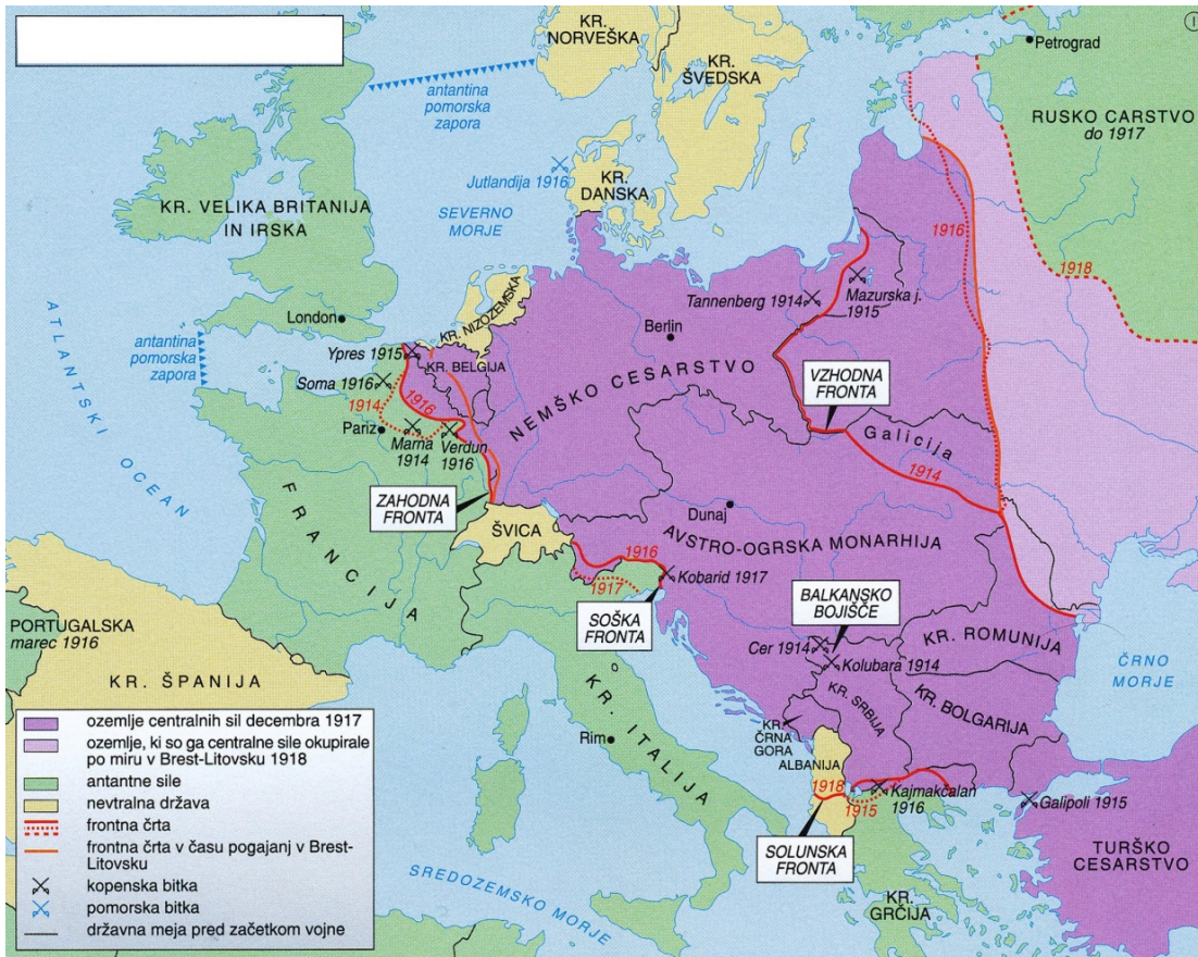
Slika 1 / 1. sz. kép: Evropa v prvi svetovni vojni