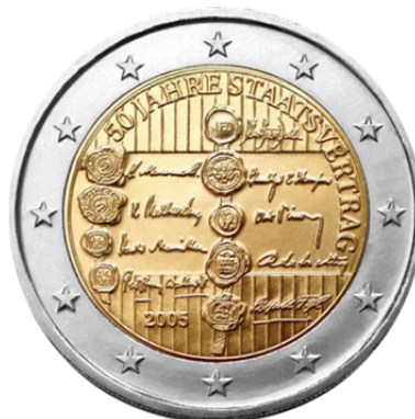
Slika 5 / 5. sz. kép: Spominski kovanec ob 50. obletnici podpisa avstrijske državne pogodbe