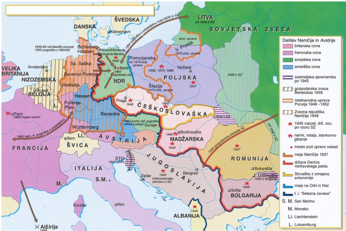
Slika 4 / 4. sz. k p: Srednja Evropa v letih 1945–1980

V sivo polje ne pišite. / A szürke mezőbe ne írjon!