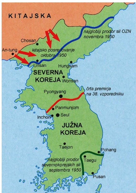
Slika 5 / 5. sz. kép: Korejska vojna

(Vir: Gabrič, A., in Režek, M., 2011: Zgodovina 4, str. 98. DZS. Ljubljana)