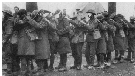
Slika 1 / 1. sz. kép

Ismertesse ezen fegyver használatának két következményét!