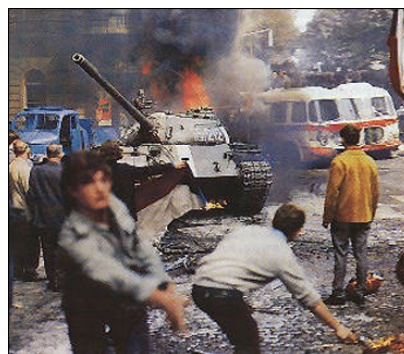
Slika 6 / 6. sz. kép