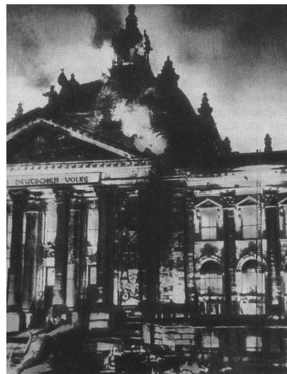
Slika 3 / 3. sz. kép