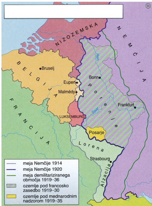
Slika 2 / 2. sz. kép: Nemška zahodna meja v letih 1923–1936