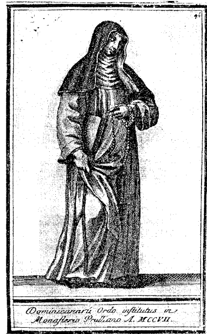
Slika 6: Dominikanka

(Vir: Mlinarič, J., 1997: Marenberški dominikanski samostan 1251–1782, str. 16. Pokrajinski arhiv Maribor)