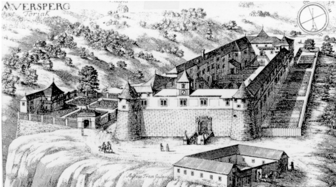
Slika 3: Grad Turjak