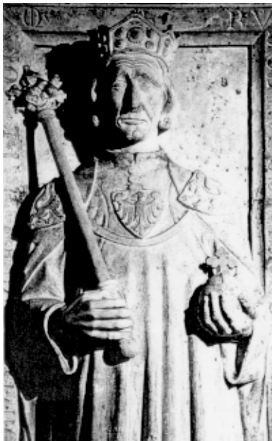
(Vir: Svetovni zakladi, Dediščina človeštva, str. 47. Mladinska knjiga. Ljubljana, 2001)