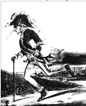
Slika 5: Kanclerjev beg