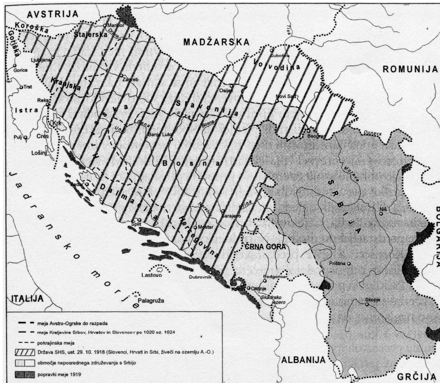
Zemljevid 1: Nastanek Kraljevine Srbov, Hrvatov in Slovencev