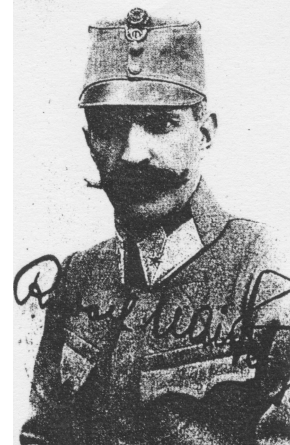
Slika 2: General in pesnik