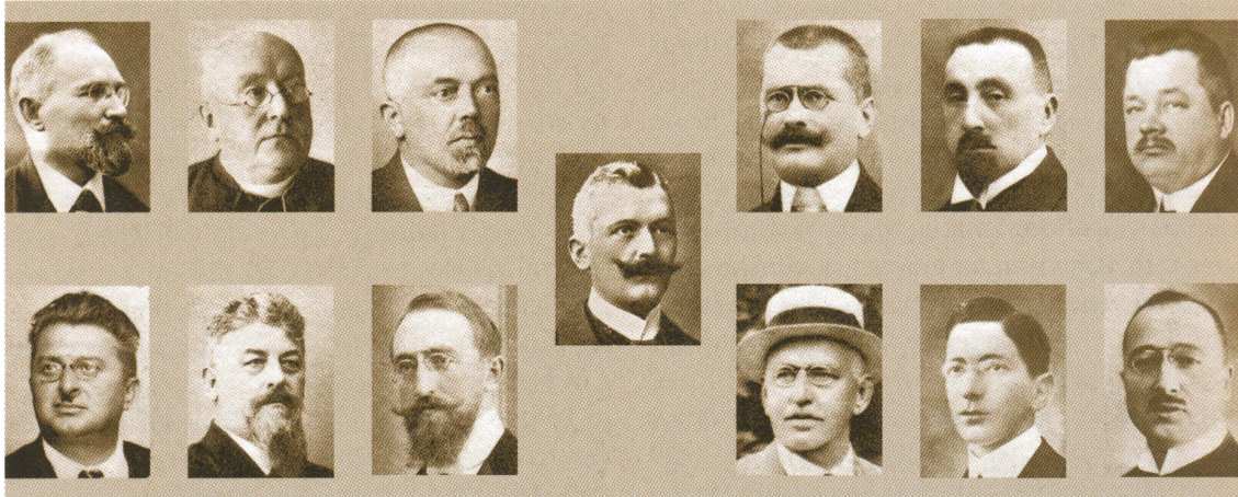
Slika 1: Narodna vlada