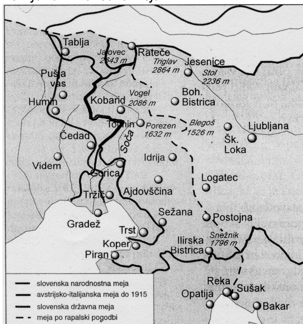
Zemljevid 2: Zahodna meja