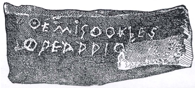
(Vir: Tukidides, 1958: Peloponeška vojna, str. 79. DZS. Ljubljana)