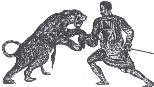
Slika 6: Gladiatorjev boj