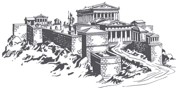
Slika 2: Atene

(Vir: Artner, T., 1968: Srečanje z antično umetnostjo, str. 128. Mladinska knjiga. Ljubljana)