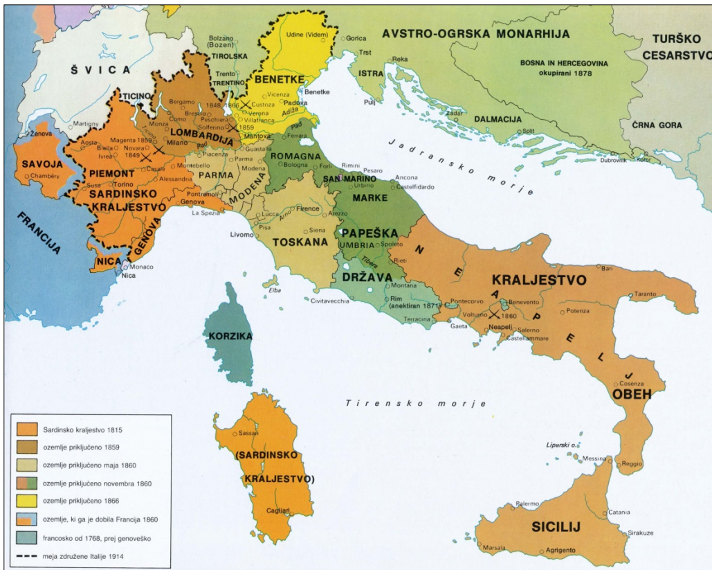
Slika 8: Združitev Italije