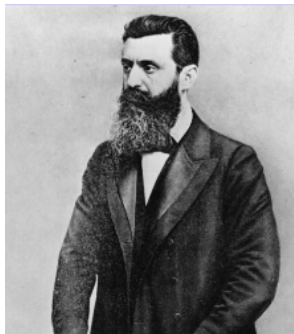
Slika 2: Oče političnega sionizma