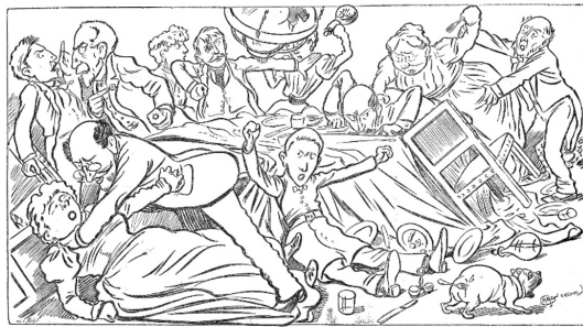
Slika 1: Pri večerji, 1898