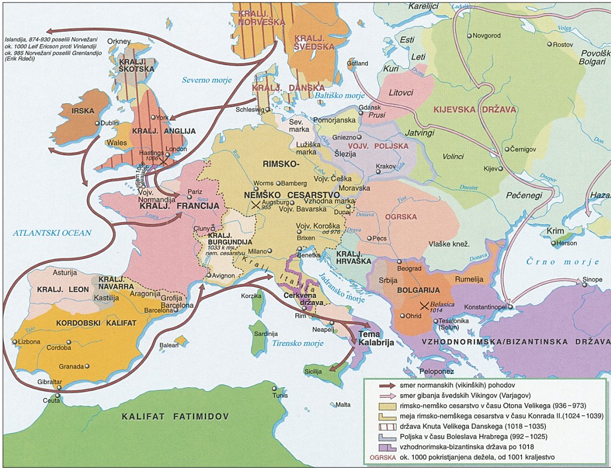
Slika 10: Evropa okoli leta 1000