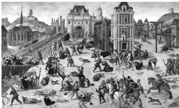
Slika 5: Šentjernejska noč