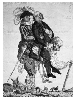
Slika 1: Stanovska država

(Vir: http://pzv.splet.arnes.si/arhontologija/ . Pridobljeno: 6. 12. 2020.)