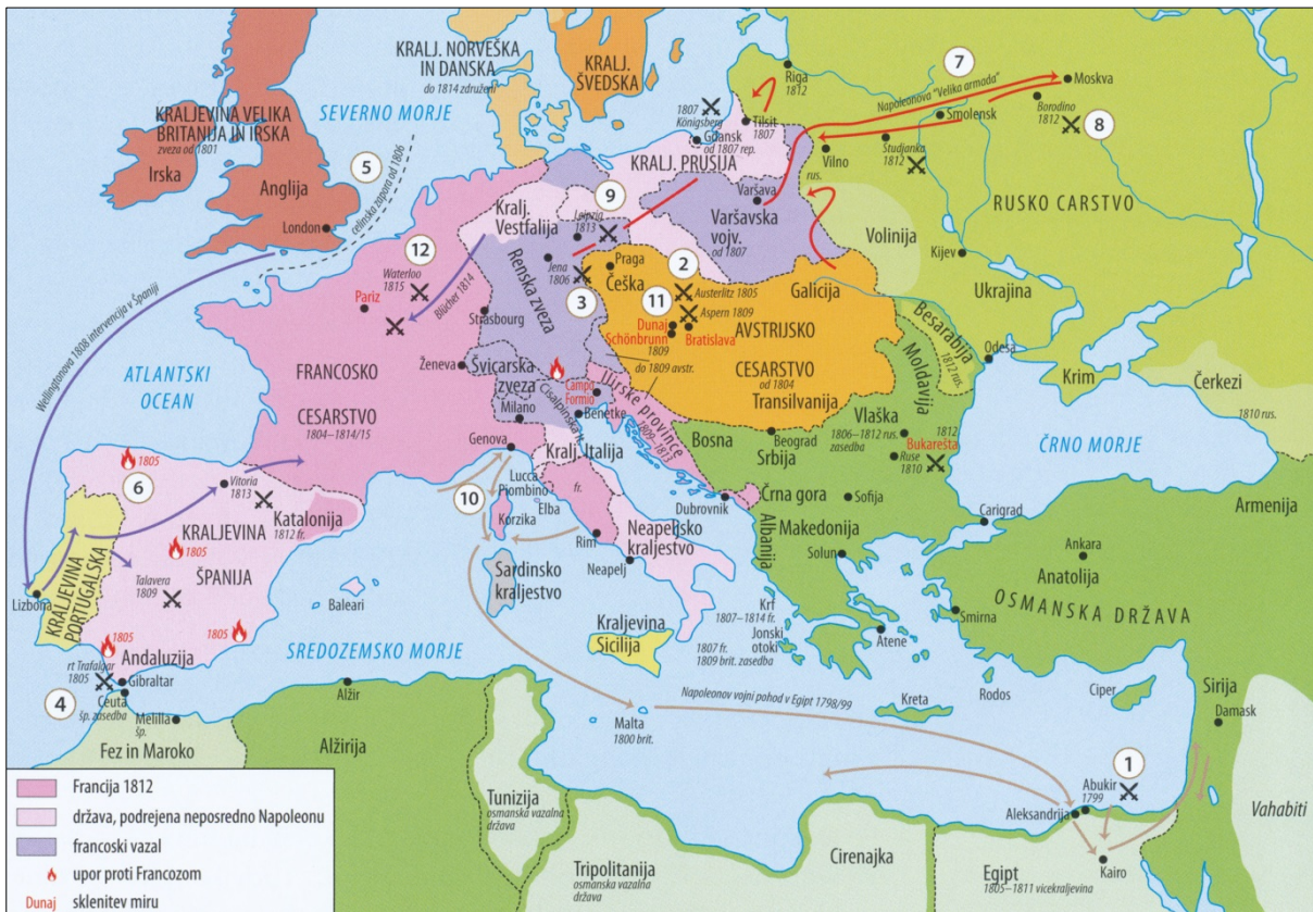
Slika 5: Napoleonova osvajanja