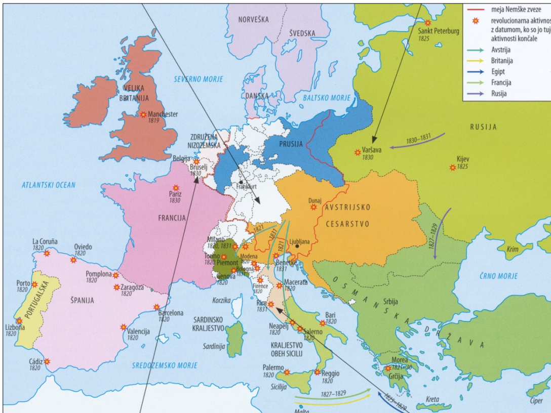
Slika 6: Revolucija v Evropi

(Vir: Brodnik, V., in drugi, 2020: Zgodovina 3, str. 47. Mladinska knjiga. Ljubljana)