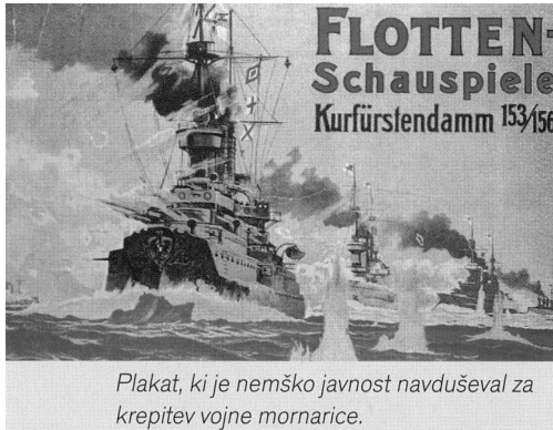
Plakat, ki je nemško javnost navduševal za krepitev vojne mornarice.