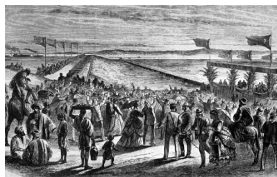
Slika 4: Slovesno odprtje v Port Saidu