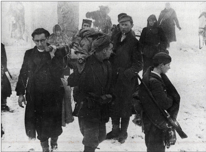
(Vir: Repe, B., 1997: Naša doba, str. 197. DZS. Ljubljana)