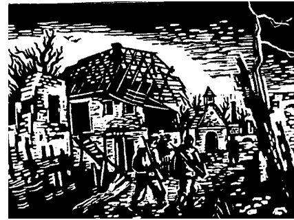
Slika 4: Najbolj razvita umetniška tehnika med vojno