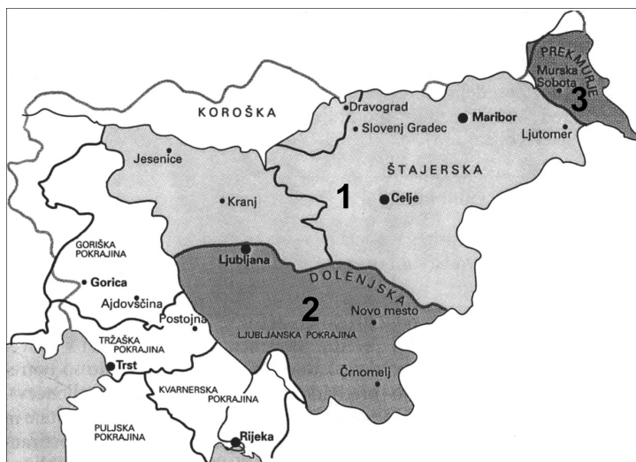
Karta 1: Okupacijska območja v Sloveniji