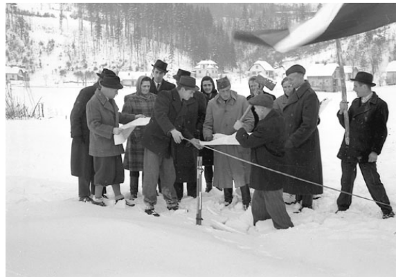
Slika 5: Delitev zemlje na Lavrici januarja 1946