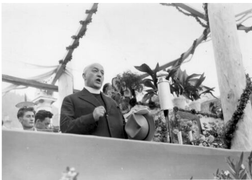
Slika 1: Prvak Slovenske ljudske stranke Anton Korošec na proslavi 20-letnice Jugoslavije v Šoštanju