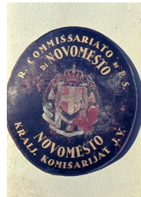
Slika 3: Napisna tabla iz časa italijanske zasedbe Novega mesta