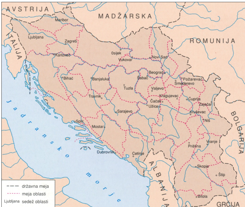
Slika 7: Kraljevina Srbov Hrvatov in Slovencev