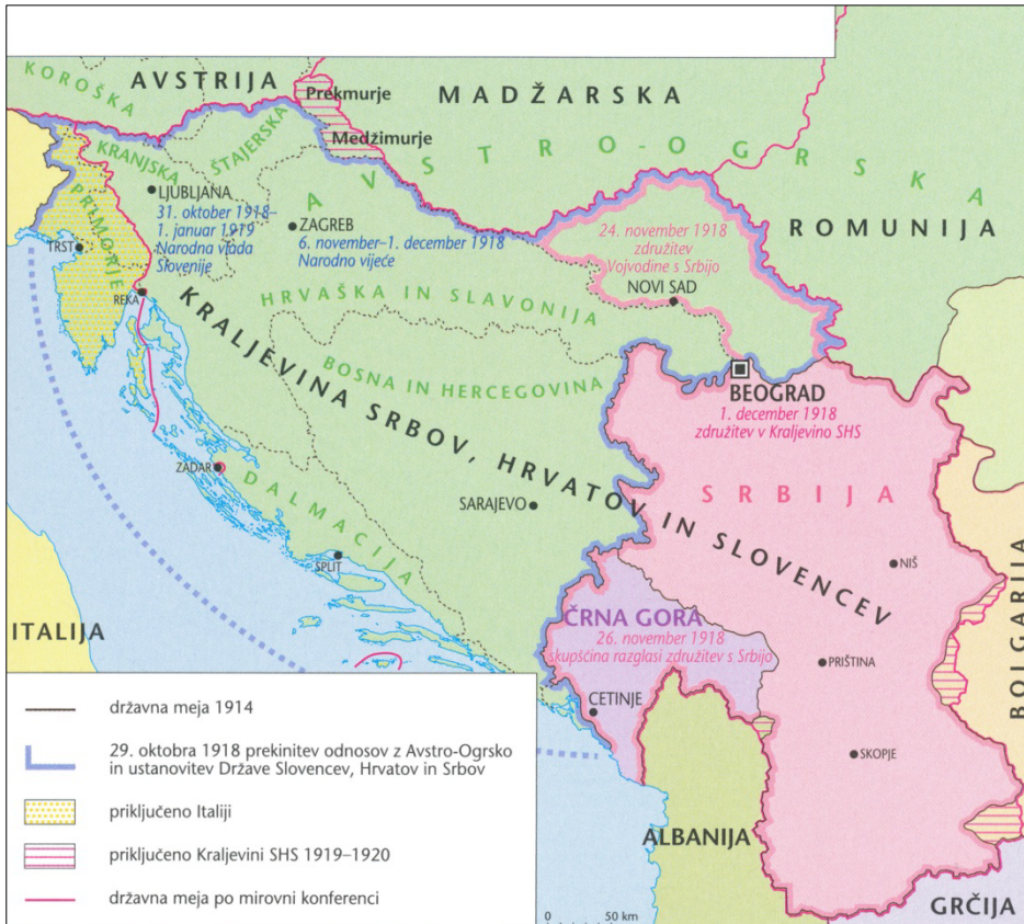
Slika 6: Nastanek Kraljevine SHS

V sivo polje ne pišite. V sivo polje ne pišite. V sivo polje ne pišite. V sivo polje ne pišite. V sivo polje ne pišite.