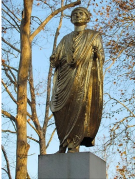
Slika 2: Kip Emonca