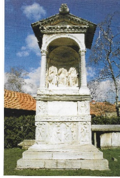
Slika 3: Spektacijeva grobnica