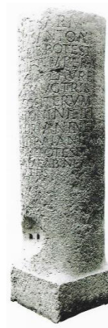
Slika 1: Miljnik