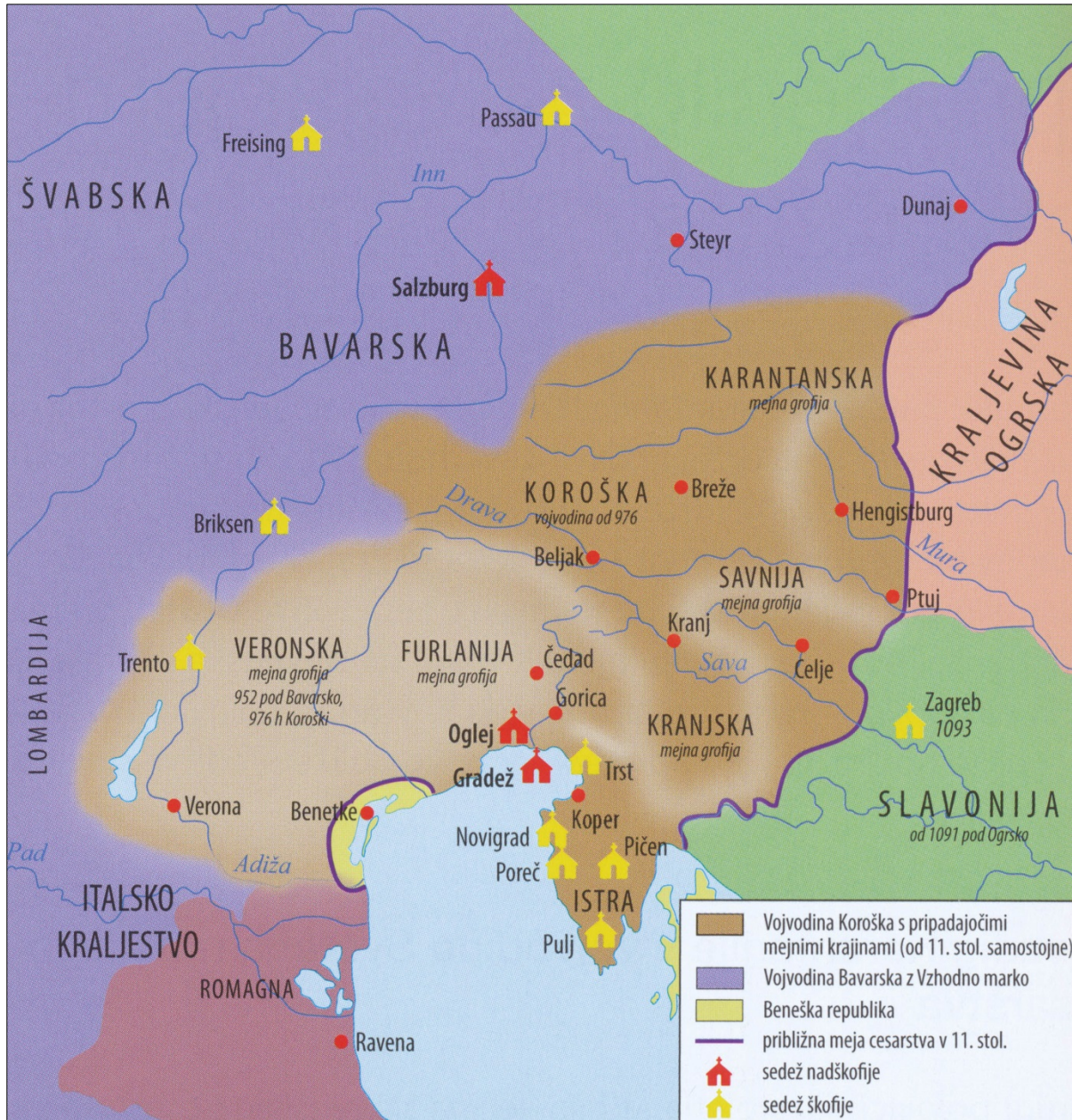
Slika 8: Upravna ureditev cesarstva 11. stoletju