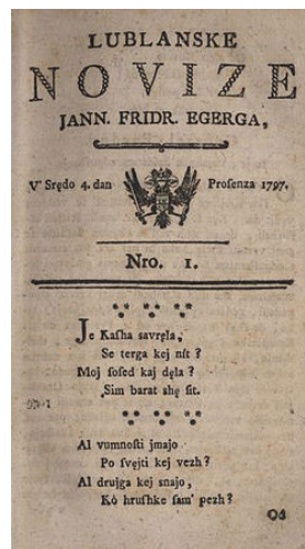
Slika 1: Lublanske novize

14.1. Kako se je izboljšal položaj slovenskega jezika v času Ilirskih provinc?