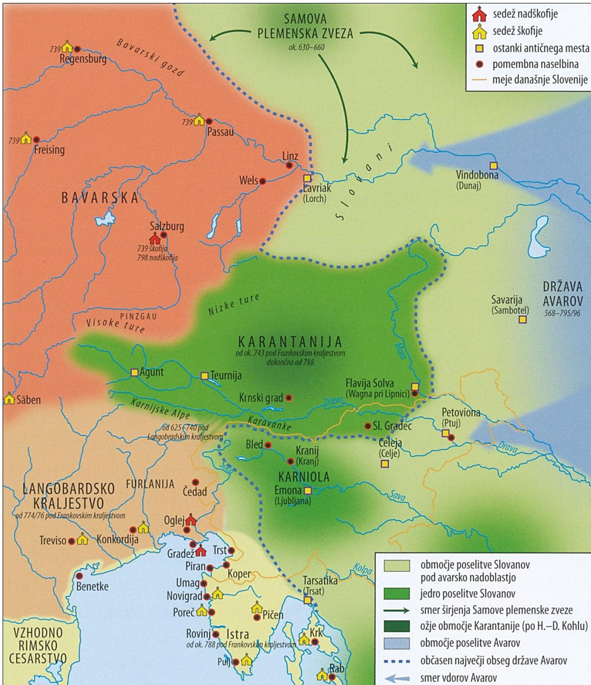
Slika 2: Alpski Slovani v 7. in 8. stoletju