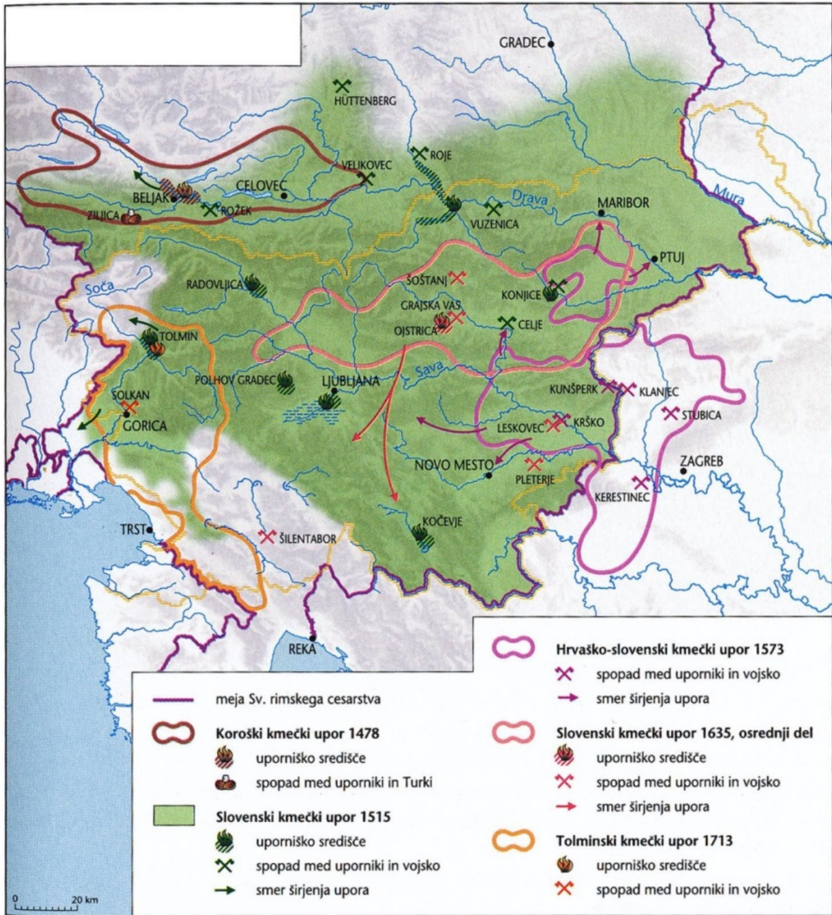
Slika 4: Največji kmečki upori