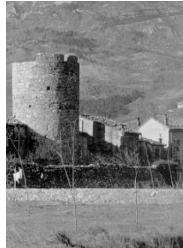
Slika 1: Ostanki rimskega obzidja