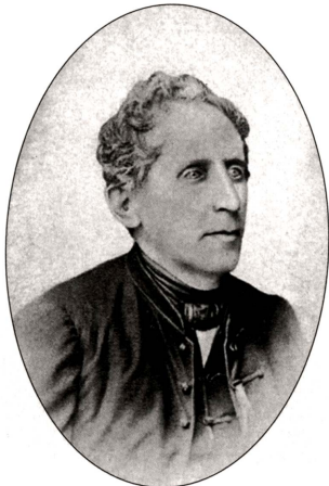
Slika 4: Janez Bleiweis