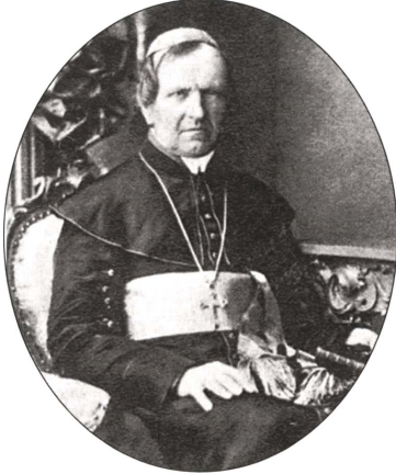
Slika 6: Anton Martin Slomšek

(Vir: Granda, S., Rozman, F., 2002: Zgodovina 3, str. 49. DZS. Ljubljana)