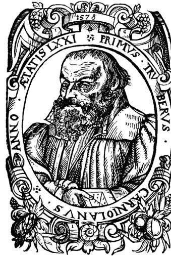
Slika 5: Primož Trubar