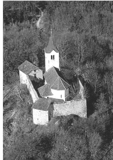
Slika 4: Tabor nad Cerovim pri Grosupljem