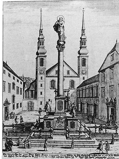
Slika 6: Jezuitski kolegij v Ljubljani

Navedite tri načine, s katerimi sta oblast in Cerkev nastopila proti reformaciji.