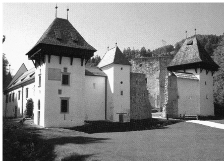
Slika 3: Žička kartuzija

Obkrožite črke pred štirimi znamenitimi srednjeveškimi samostani na Slovenskem.