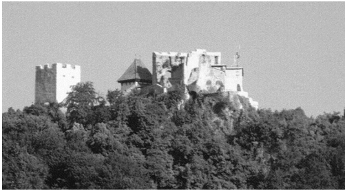
Slika 2: Celjski grad