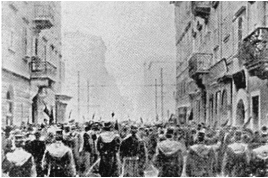
Slika 2: Zborovanje delavcev v Trstu 1902

(Vir: Cvirn, J., in Studen, A., 2010: Zgodovina 3, str. 146. DZS. Ljubljana)