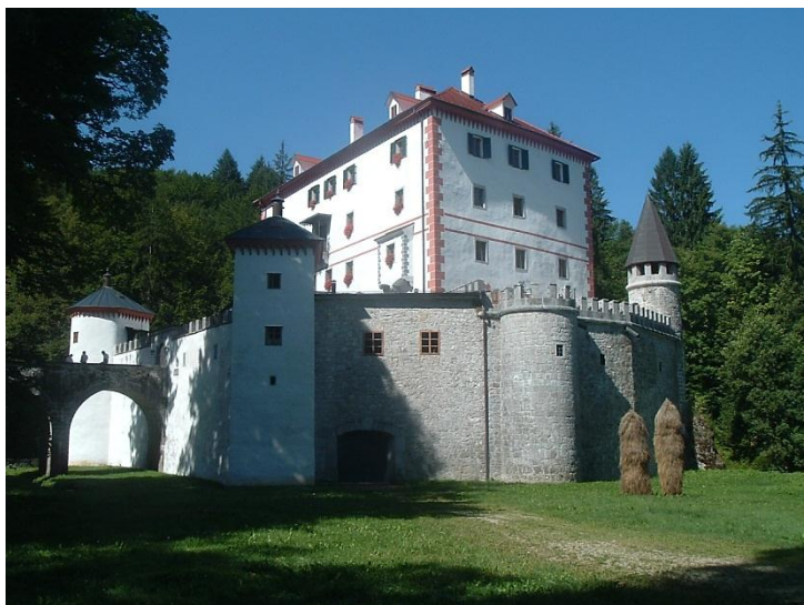
8. sz. kép

8. Figyeld meg a 8. sz. képet, és oldd meg a feladatot!