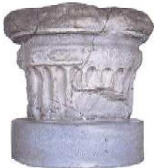
6. sz. kép

7. Figyeld meg a 6. és 7. sz. képet, és oldd meg a feladatot!