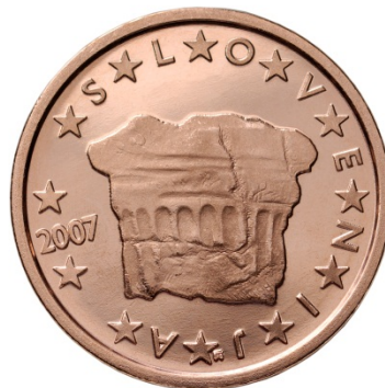
7. sz. kép