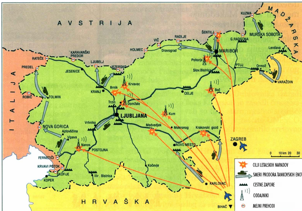
Zemljevid 1: Smeri prodora JLA in večji spopadi v Sloveniji leta 1991