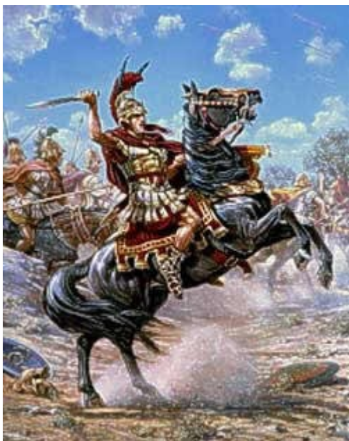
Na sliki Aleksander jezdi Bukefala in se bojuje z nasprotniki