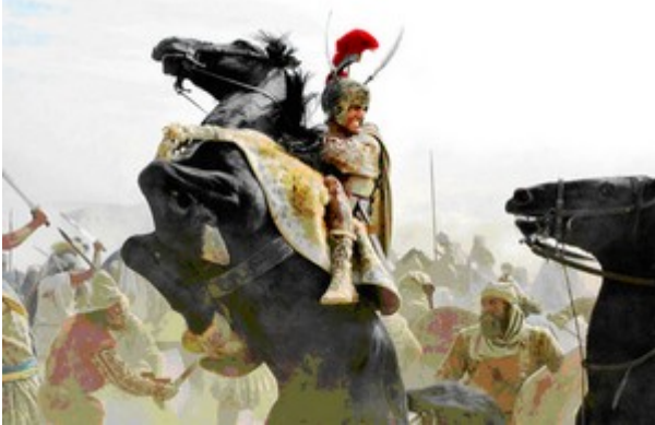
Slika iz filma Aleksander, ko se je Aleksander bojeval proti Perzijcem

Vojski sta se spopadli v Kilikiji pri Isosu. Toda Darej je imel nesrečo saj je bil kraj preveč ozek in zato se perzijska konjenica ni mogla razviti kot je Darej pričakoval. Na eni strani je bojno polje omejevalo gorovje na drugi pa ocean. Ker so imeli Perzijci preveč konjenice, se ni mogla pokazati prava moč Perzijske elite. Tako se je pa pokazala večja manevrska sposobnost makedonske. Ko je bilo očitno da bo Perzijska vojska izgubila je Darej raje pobegnil, kot da bi ga Aleksander dobil v svoje roke. Čeprav poraz ni pomenil konec Perzije je imel Aleksander prosto pot v Fenicijo. Po končani bitki je obležalo kar 110.000 žrtev. Veliko je bilo spremstva. Makedonci so ujeli Darejevo mater, ženo in dve še neporočeni hčeri. Z njimi so ravnali po kraljevsko.