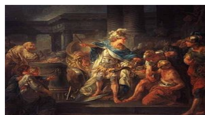
Slika 4: Aleksander Veliki seka gordijski voz

Že kmalu po začetku vojnega pohoda po Aziji je po prehodu Helesponta prišlo pri Graniku do prve večje bitke med mladim makedonskim vojskovodjem Aleksandrom III. in najemniškimi vojaki, ki so jih nadenj poslali perzijski satrapi. Brez posebnih priprav je zmagal, na nasprotnikovi strani je padlo 20.000 mož,