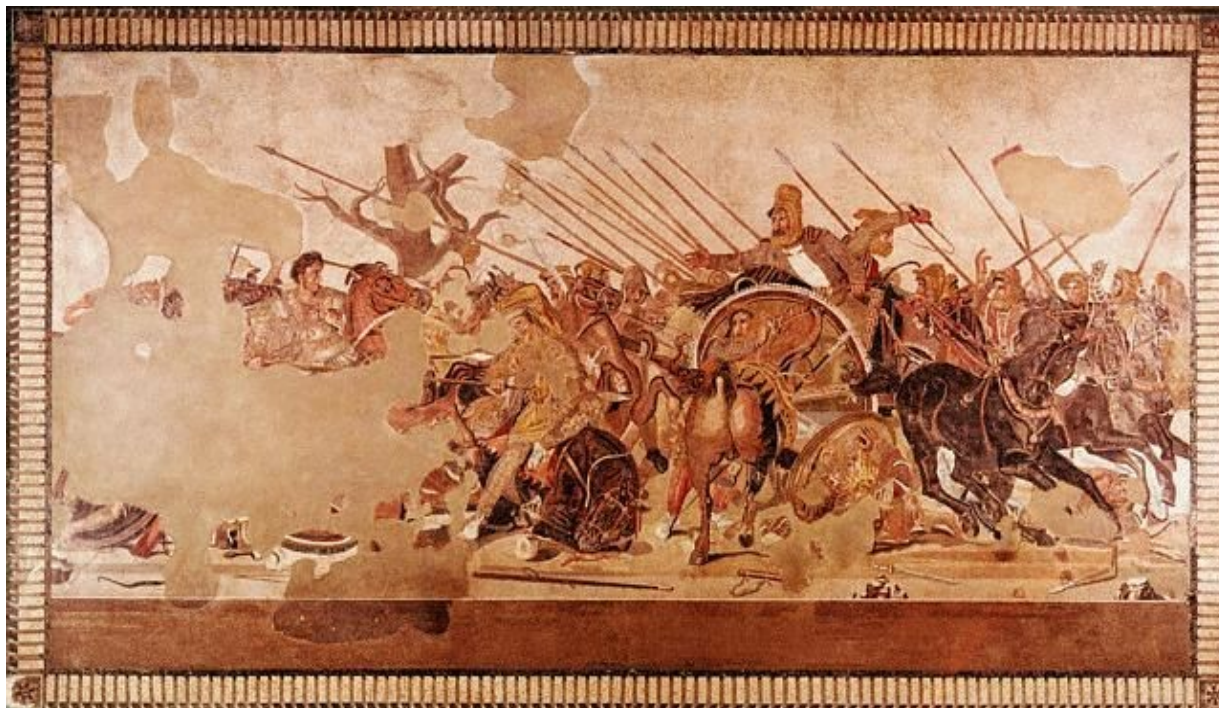
Slika 5: Bitka pri Issu, mozaik iz 2. stoletja pr. Kr.

Darej III. je v bojni zmedi panično zapustil svojo vojsko in izgubil bitko. Ta je bila kratka in zelo krvava, zmagovalec pa je bil jasen. Kralj Darej je v zajetem taboru pustil svojo družino. Zajeli so jo Aleksandrovi vojaki, Aleksander pa jim je prizanesel in z njimi spoštljivo ravnal. Po tej bitki je od perzijskega kralja Dareja dobil predlog za sklenitev miru s Perzijo, a ga je zavrnil.