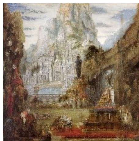
Slika 7: Dvanajst oltarjev – najvzhodnejša točka Aleksandrovih osvajanj

Aleksander je nameraval nadaljevati s pohodom, a je obstal pred 5,5 kilometra široko reko Ganges, kjer ga je na nasprotnem bregu čakala vojska, ki naj bi štela 80.000 konjenikov, 200.000 pešakov, 8.000 bojnih voz in 6.000 bojnih slonov. Vojska se mu je tu dokončno uprla, ker se ni bila pripravljena spopasti z več kot dvakrat večjo vojsko. Aleksander je sprva skušal upor zatreti, a je po nekajdnevnem premisleku popustil, kar je Aleksandrova vojska sprejela z navdušenjem. Na najvzhodnejši točki, ki jo je dosegel, je dal postaviti ogromne kamnite oltarje, poleg pa je dal vklesati napis v grščini: »Aleksander se je