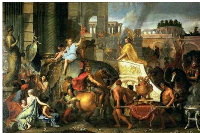
Slika 6: Aleksander Veliki v Babilonu

Aleksander je po bitki pri Gavgamelah nadaljeval pohod proti Babilonu, v katerega je z vojsko vkorakal brez boja. V zahvalo in da bi se prikupil Perzijcem, je žrtvoval babilonskemu božanstvu. Še pred koncem istega leta je z vojsko vkorakal v Suzo, kjer je zasegel bajne zaklade: od 1.000 do 1.250 ton zlata in še 225 ton Darejevih zlatnikov.