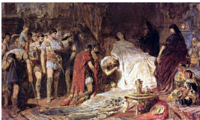
Slika 8: Aleksandrova smrt

Aleksander se je iz Perzepolisa vrnil v Mezopotamijo. V Babilonu so ga obiskali odposlanci ljudstev, katerih ozemlja še ni zavzel. To je Aleksandra spodbudilo k načrtovanju novih vojaških pohodov. A mu načrtov, kljub temu da je že začel zbirati vojsko, ni uspelo izvesti, ker je konec maja