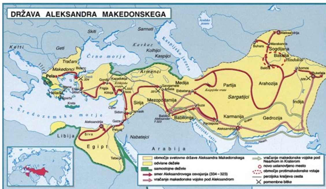
Slika 3: Država Aleksandra Makedonskega