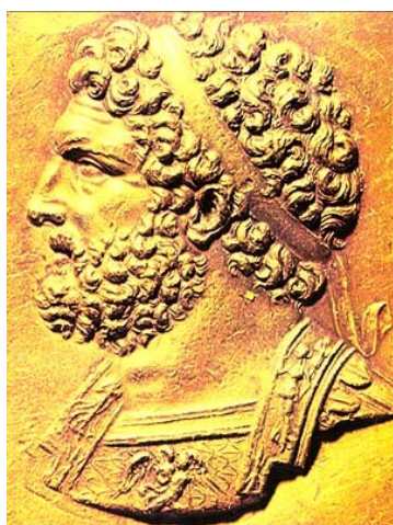
Slika 1: Filip II. Makedonski

Makedonski kralj Filip II., ki je s svojimi reformami in osvajanji kasneje omogočil uspehe svojemu sinu Aleksandru, je bil sin kralja Aminta III. Doživel je razpad makedonske države in je zato svoje otroštvo preživel kot talec v Tebah, kjer je spoznaval grško kulturo in organizacijo vojske, strategijo vojskovanja ter način vodenja države v grškem polisu. V tem času je spoznal Epaminodasa, po vzoru katerega je kasneje reorganiziral vojsko. Na oblast se je povzpел tako, da je zlomil moč drugih kraljevih družin v Makedoniji. Ko je leta 359 pr. Kr. prišel na prestol, mu je uspelo dobiti nadzor nad rudnim bogastvom celotne dežele, največ bogastva mu je prinesel sredi 4. stoletja pr. Kr. odkriti pangajski rudnik zlata in srebra. Gospodarske danosti Makedonije so mu s pomočjo znanja, ki ga je pridobil, omogočile, da je ustvaril takrat najboljšo vojsko v vsej Grčiji.