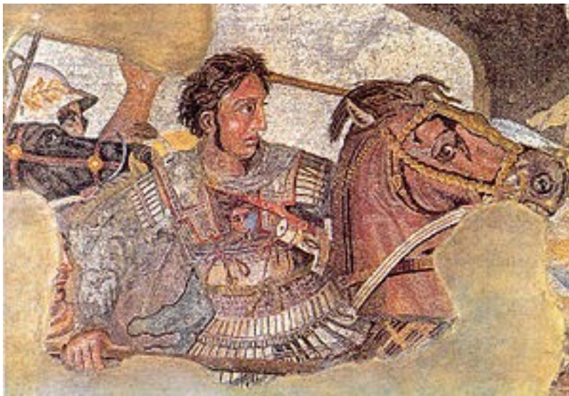
Slika 2:»Najbolj znan portret Aleksandra na svojem konju Bukefalu v eni izmed prvih bitk«

Pri 16 letih je Aleksander prevzel oblast in čuval državni pečat. Še isto leto je Aleksander vodil pohod proti uporniškim Majdom, nepokornemu Tržaškemu ljudstvu. Aleksander jih je pregnal, ko je zavzel njihovo prestolnico in v njej naselil nove priseljence, mesto pa je poimenoval po sebi v "Alexandroupolis". Leta 338 p.n.š. je Filip povedel svojo vojsko nad Grke in jih v bitki pri Hajroneji odločilno premagal, Aleksander pa je poveljeval takrat levemu krilu vojske. Ko so Makedonci zmagali, so Aleksandru naročili naj odnese Atencem pepel njihovih vojakov, ki so padli v bitki, takrat je Aleksander prvič in zadnjič bil v Atenah, mestu katerega kulturo je nadvse občudoval. Ena njegovih prvih odločitev je bila poraziti balkanska ljudstva na severu, ker so se stalno upirali in uničevali Makedonski trg, zato so bili spopadi na Balkanu generalka za Makedonijo.