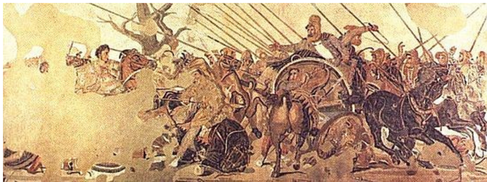
Slika 4: »Aleksander v bitki pri reki Granik«