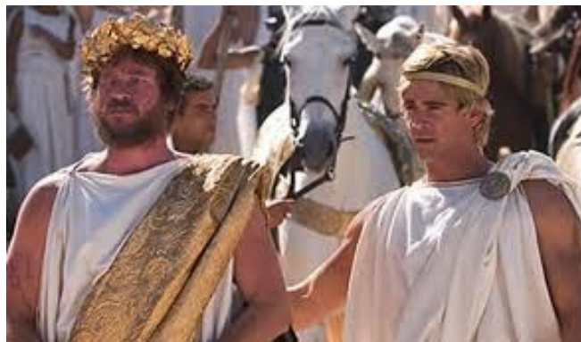
Slika 1: »Filip 2. in Aleksander«