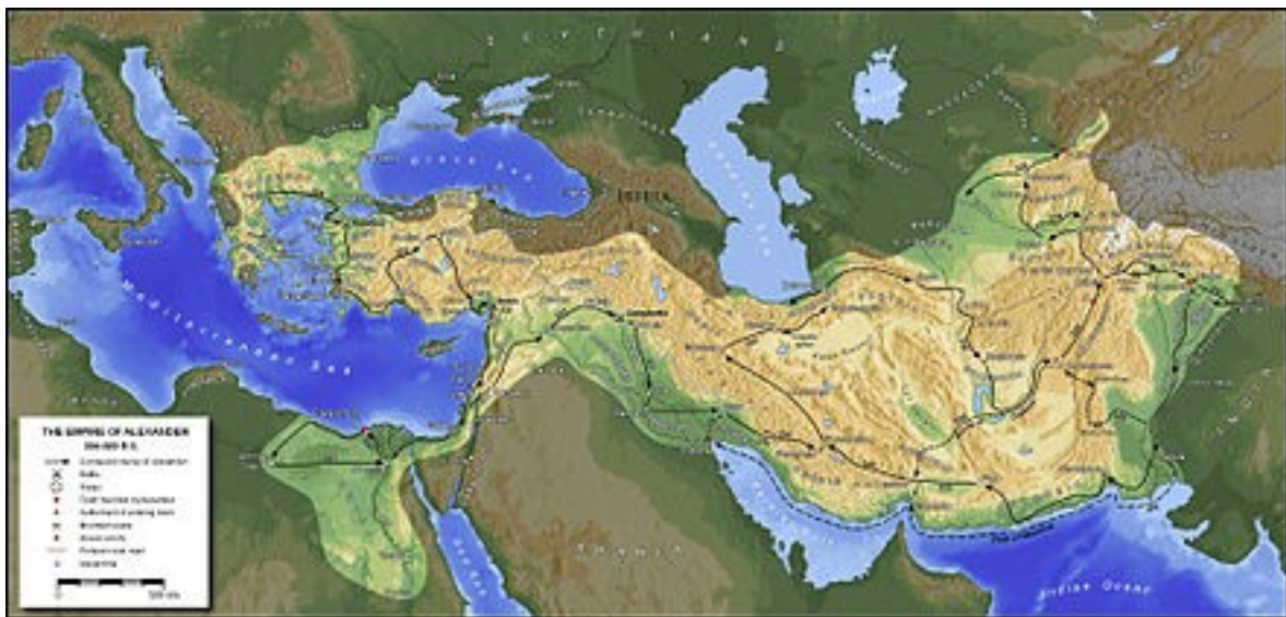
Slika 5: »Makedonski imperij, katerega je osvojil Aleksander«