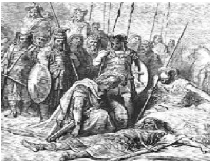
Slika 5: Aleksander najde mrtvega Dareja.

Veliki kralj, ki ni uspel zbrati dovolj močne vojske, da bi se uprl Aleksandru, se je iz Ekbatane začel umikati proti Baktriji. Med begom se je proti njemu zarotil satrap Bes, ki je dal Dareja umoriti. Že julija tega leta se je Bes dal sam oklicati za Velikega kralja z imenom Artakserkses IV.