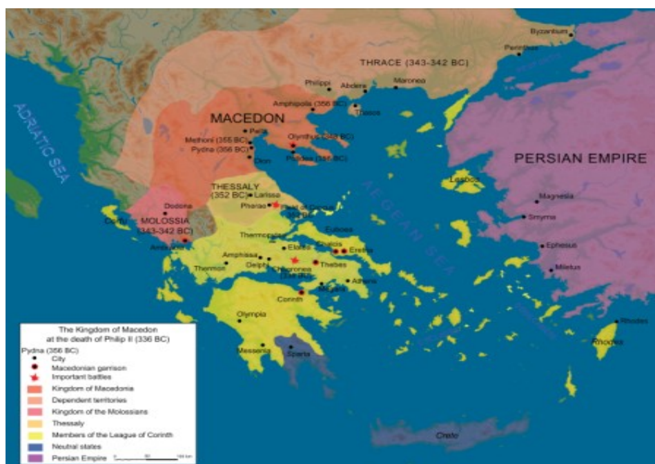
Slika 1: Makedonija po smrti Filipa II. Makedonskega.

Leta 4. st.p.n.š. je v grškem svetu prevladovala Makedonija. Ležala je med Tesalijo na jugu, Epirom na zahodu, na severu jo je omejevala Trakija na vzhodu pa polotok Halkidika. Bila je bistveno večja od ostalih grških držav, gospodarstvo so imeli zgrajeno na poljedelstvu, lesni industriji in kovinarstvu. V tem stoletju, so odkrili rudnik zlata na gori Pangaj. S tem si je Makedonija, še dodatno okrepila gospodarsko moč. Kralji so dobili možnost, da vzdržujejo večje število vojakov. Za kralje je veljalo dedno pravo.