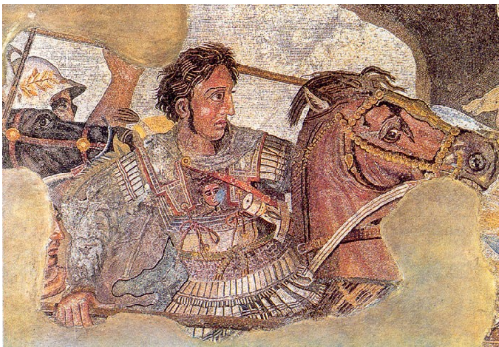
Slika 3: Upodobitev Aleksandra Velikega.