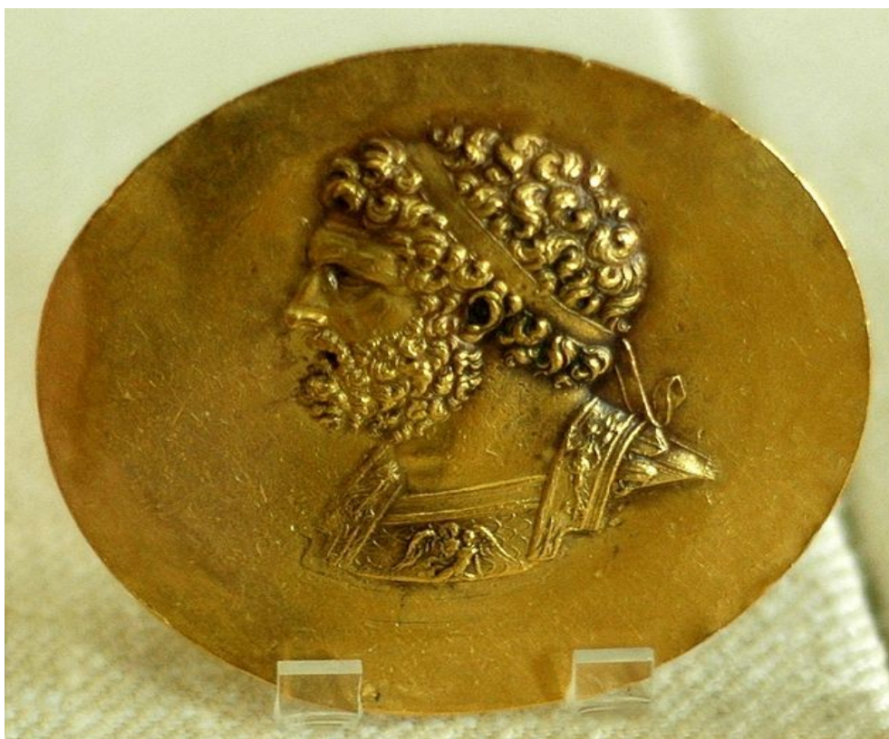
Slika 2: Zlatnik s podobo Filipa II. Makedonskega.

tem času se je možila tudi Filipova hči Kleopatra. Filip se je udeležil te velike slovesnosti v prestolnici, kjer pa ga je umoril mladi makedonski plemič Pausanias in priprave so prekinili. Po smrti Filipa II. je njegovo mesto prevzel njegov dvajsetletni sin Aleksander III. Makedonski oz. Aleksander Veliki.