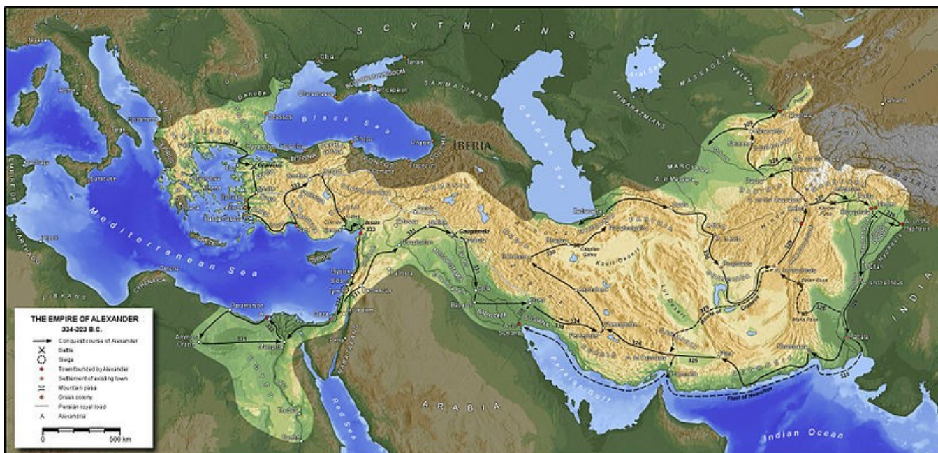
Slika 6: Aleksandrov imperij v največjem obsegu.