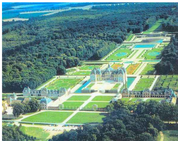
Slika 1: Vaux-le-Vicomte

Življenje v času baroka in absolutizma je bilo težko. Na življenje ljudi so vplivali različni dejavniki kot so: nalezljive bolezni (v tistem času je bila zelo razširjena bolezen kuga, zato so ljudi, ki so bili okuženi z njo naselili na svežem zraku in pitni vodi in s tem preprečili širjenje bolezni), higiena, saj v tistem času milo in voda nista bila v modi, lakota, saj so bila mesta vedno bolj naseljena. V tistem času ljudje niso poznali higiene, saj so se ljudje umivali kar na dvoriščih ali pa v vežah. Zaradi epidemij bolezni je velik del meščanstva umrl. Število umrlih se je večalo, rojenih pa zmanjšalo. Pa vendarle je mestno prebivalstvo naraščalo, zaradi priseljenih ljudi z podeželja. Barok je tako kot absolutizem umetnostno obdobje. Ravno umetnost, slikarstvo, kiparstvo in glasba so imeli v tem obdobju velik pomen. Življenje ljudi v baroku pa je bilo precej kratko. Skoraj četrtnina ljudi je umrla preden je dočakala 25 let. Med absolutizmom in barokom pa so se pojavljale tudi razlike.