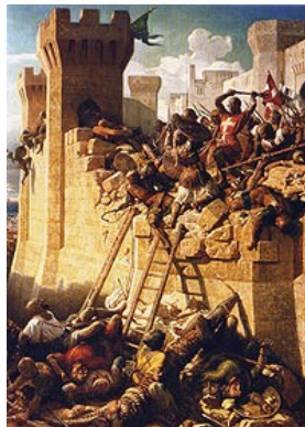
Slika 10:Baročno obzidje

Mesta so bila zaradi varnosti večinoma obdana z visokimi obzidji. Zaradi tega se niso mogla širiti. Zato so rasla v višino. V največjih mestih ni bilo nič običajnega, če so imele hiše 5 nadstropij ali več. Večinoma so bile zgrajene iz lesa, ki je bil lažji kot opeke. Kadar je v takšnih mestih zagorelo, je bilo požgano do tal. Ostale so samo hiše bogatih meščanov, ki so bile zgrajene iz opeke. Mesta so bila za tako množico ljudi čisto neprimerno opremljena. Vodovodov ni bilo. Na razpolago je bil samo mestni vodovod. Na tem vodovodu je bila voda dostikrat neužitna. Zaradi neužitne vode so imeli meščani dostikrat težave z črevesnimi boleznimi. Ulice so bile ozke, le redko tlakovane. Taka mesta so čisto drugačna kot današnja mesta. Ulice so bile težko prehodne. Ob vsakem vremenu pa je na njih vladala nesnaga. Ulice so ljudem služile za odlaganje odpadkov. Javne razsvetljave še ni bilo. Če je hotel človek zvečer ven je moral z sabo vzeti baklo. Zaradi bakel pa so mesta pogosto gorela. Veliko mest je bilo uničenih.