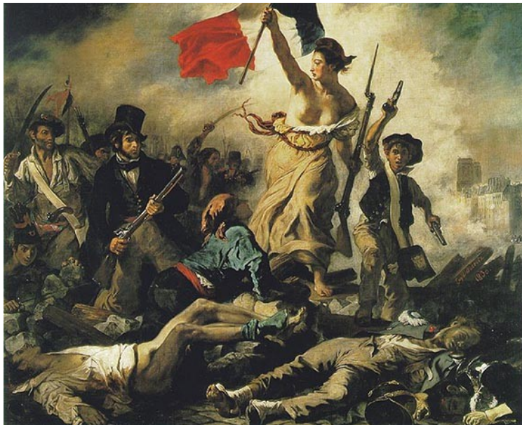
Slika 7:Upor revnih meščanov,med njimi so tudi revni otroci Link: http://www.grossmont.edu/history/courses/images/delacroix_liberty.jpg

Kmečki otroci so morali z osmimi ali desetimi leti oditi k bogatejšemu kmetu. Pri tem kmetu so delali za vsakdanji kruh. Nič drugače se ni dogajalo mestnim otrokom. Žalostno je bilo, da so v 17. stoletju otroke vedno bolj pogosteje zaposlovali v proizvodnji, manofakturah, in celo v rudnikih. V njih so tem otrokom rekli »rudarčki«. V malih jaških, ki so bili pretesni za rudarje, so morali otroci pridno polniti košare, sode ali pa usnjene vrečke z rudo. V 18. stoletju so gospodarski strokovnjaki priporočili delo otrokov v manofakturah koristno za državo ali mesto. To delo so podpirali tudi vladarji, saj so si s tem zagotovili dobiček. Ti otroci so živeli zares težko. A bolje se je godilo otrokom bogatih staršev.