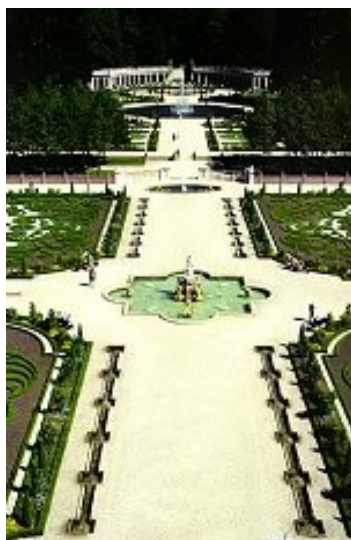
Slika 20: Moj dvorec

Slika19: link: http://mojametodika.com/blog/wp-content/uploads/2007/06/barok2.jpg