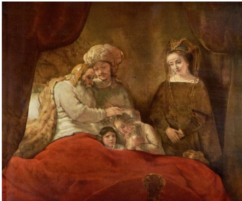
Slika 6: Bogatejši meščani

dočakalo pedesetega leta. Revni ljudje(ljudje iz nižjih slojev) so začeli umirati že pred svojim štiridesetem letu. Umirali so predvsem zaradi pomanjkanja hrane in izčrpanosti pri delu. Bogati pa so kljub izubilju živeli le kakih 10 let več. Otroštvo je preživelo več žensk kot pa moških, vendar pa so kasneje ženske ogrožali porodi. Kar petina žensk je pri porodu umrla. Stanje hitre umrljivosti so povzročile epidemije bolezni. Zato revni ljudje niso živeli več kot 40 let, bogatejši pa več kot 50 let.