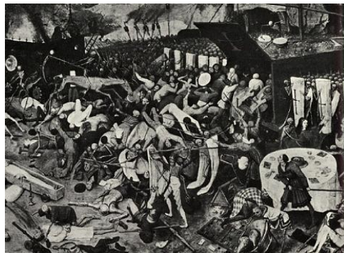
Slika 12: Posledice slabe higijene

težave. Kopališča niso bila redkost niti na gradovih in hišah bogatašev. V baroku pa so taka kopališča zaradi spodobnosti zaprli. Ljudje so se kar odvadili umivati in skrbeti za higijeno. V hišah ni bilo starnišč. V ta namen so izrabili kar dvorišča ali drugi malo bolj skriti kotiček na prostem, pa tudi v vežah. Najrazličnejši marčes je bil vsakdanji spremljevalec bogatih in revnih ljudi. Umazanija in osebna higijena nista bili vrline baročnega človeka. O ljudeh tistega časa so govorili, da niso poznali ne spodnjega perila. Imel pa je razkošne obleke, čipke in svilene nogavice. Poznali niso niti stranišč. Mnoge nizozemske hiše so bile vzor reda in čistoče in tudi vzhodni svet se ni odrekel stare kopalne navade. Zdravniki, ki so bili popolnoma nemočni v boju z nalezljivimi boleznimi, so priporočali snažnost, vodo in svež zrak. V obdobju baroka je bila najbolj razširjena nalezljiva bolezen kuga. V njenem času so sklenili obolele naseliti v posebnih bolnišnicah, ki naj bi stale na kraju, kjer je bilo mogoče zračenje in tekoča pitna voda. Osamitev je bila takrat največ ,kar so lahko naredili, da se bolezen nebi širila.