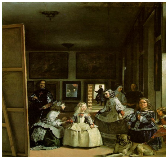
Slika 21: Moji svetovalci