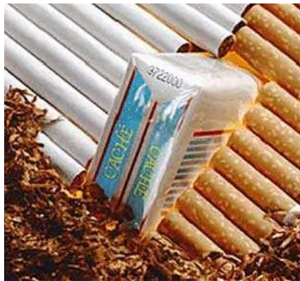
Slika 14: Tobak, ki je prihajal v modo

Slika13: link: http://www.idrija.ws/upload/images/6995komunala_voda1.jpg