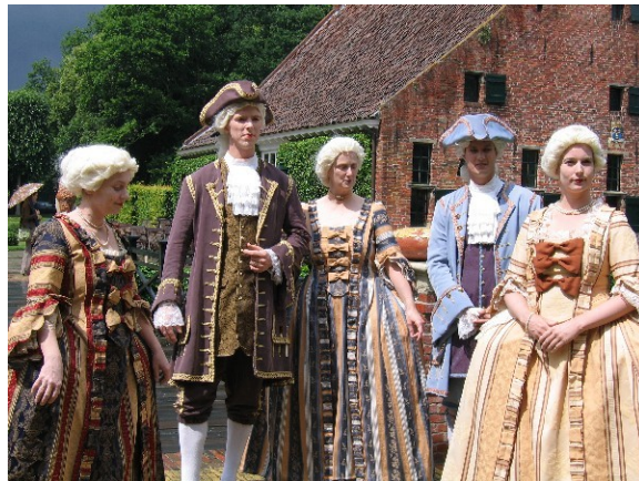
Slika 8: Bogati meščani

V premožnih družinah so morali otroci čimprej odrasti. Ti otroci so bili sicer bolj hranjeni in negovani, kakor revni. Imeli so tudi dragocene igračke. Imeli so omogočeno šolanje. Starši pa se z otroki niso mogli igrati zaradi svojih obveznosti. Tudi ukvarjali se niso z njimi. Ko so otroci končali šolanje, so jih odrasli poslali od doma. Poslali so jih v samostan ali kako drugo šolo ali pa na dvor. Tam so se naučili lepega vedenja. Njihovo vedenje so strogo nadzorovali, da ne bi zapadli pod vpliv slabe družbe. Ko so bili pripravljene in zadosti stari za poroko, so jim starši našli partnerja ali partnerjico, s katero se bo poročil. Moža ali ženo so iskali s pomočjo sorodnikov. Partner jim je moral biti enak po družbeni veljavi in premoženju. Življenje bogatih otrok lahko primerjamo z nami, brez tehničnih pripomočkov, saj bomo tudi mi nekoč naredili šolo, odšli na srednjo šolo, študij, se poročili in imeli službo. Vendar pa se naši starši bolj ukvarjajo z nami kakor pa starši bogatih otrok v baroku.