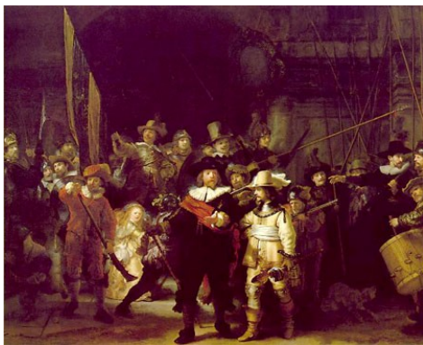
Slika 4:Obleke stražarjev

René Descartes i samtal med Sveriges drottning, Kristina.jpg