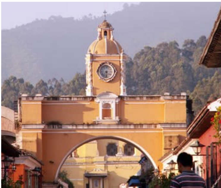
Slika 9:Stil španskega baročnega mesta

Mesta so bila polne nesnage in bede(smrad). V teh mestih je živel velik del prebivalstva. Zaradi nesnage, smradu in nečistoče je prihajalo do večjih izbruhov epidemij bolezni. Ravno zaradi bolezni, je umiralo veliko prebivalstva(zaradi bolezni so ustvarjali tudi posebne bolnišnice). Število rojenih je bilo manjše, kot pa število umrlih. Pa vendarle je prebivalstvo naraščalo. Naraščalo je zaradi priseljencov. Ti priseljenci so bili predvsem iz podeželja. Dvanajst evropskih mest, to so bila glavna mesta držav(Pariz) je imelo v 17. stoletju več kot 100.000 prebivalcev. Preostala manjša mesta pa so bila precej manjša.