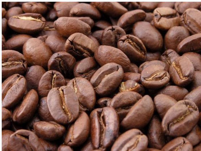
Slika 16: Kava, ki je bila v modi v času baroka

Slika15: link: http://www.korak.ws/image/medium/19300/_1223966542