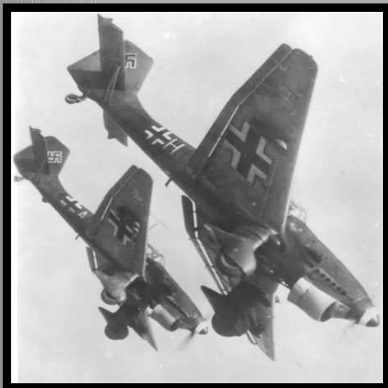
Junkers JU 87B-1