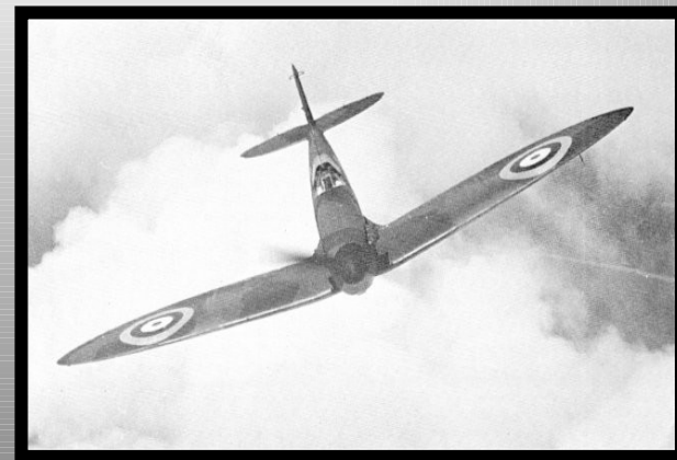
Vicker supermarine spitfire