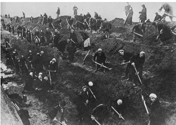
Slika 5: Z vsemi možmi na fronti, moskovske ženske kopljejo protitankovske jarke

13. novembra 1941 so se v Orshi srečali visoki nemški poveljniki. Na tem sestanku je bila sprejeta odločitev, da začnejo drugi napad na Moskvo. Medtem so Rusi poslali v Moskvo še dodatnih 100000 mož, 300 tankov in 2000 topov. Moskva se je spremenila v utrdbo s 680 kilometri protitankovskih jarkov in 1300 kilometri bodeče žice. Nemci so načrtovali, da bi naredili čim večjo škodo na majhnem območju, saj so verjeli, da bodo tako lažje prodrli v sam center Moskve. To jim je tudi uspelo vendar so se srečali z divjim ruskim odporom, ki ni popustil. Prišli so še 30 kilometrov v notranjost, vendar je ruska obramba zdržala.