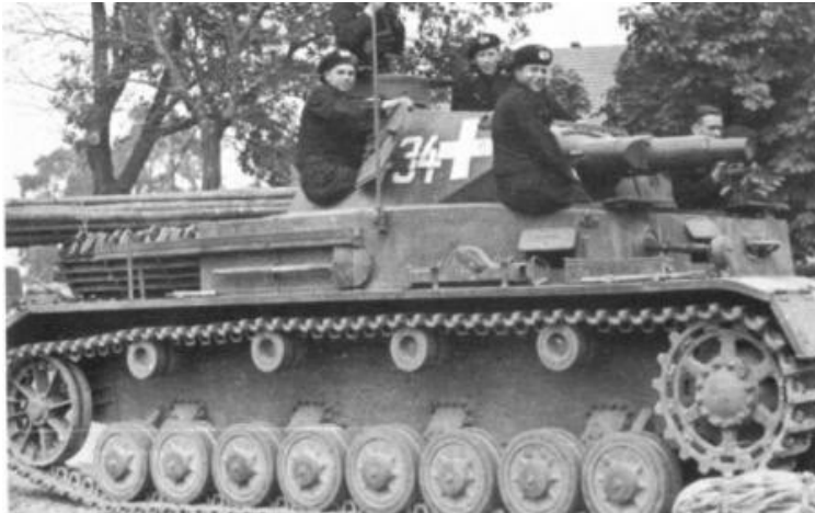
Slika 4: Nemški tank Panzer IV

težave z gorivom in slabe ceste pripeljale k temu, da so dosegli obrobje Tule šele 26. oktobra 1941. Prvi poskus zavzetja Moskve je spodletel. Nemški panzerji so bili zaustavljeni s strani 50. armade in civilnih prostovoljcev v obupni bitki. Guderianova vojska se je ustavila na vidnem mestu 29. oktobra 1941.