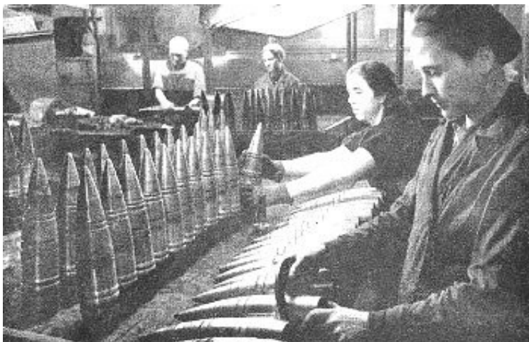
Slika 3: Orožje proizvedeno v eni od moskovskih oborožitvenih tovarn

Zhukov je organiziral obrambo vzdolž tako imenovane Mozhaiske črte. Ruski general se je odločil, da bo zgostil svoje enote na štiri kritična območja. Celotna sovjetska Zahodna fronta je na novo zaživela. Tovarna avtomobilov se je spremenila v tovarno avtomatskega orožja, tovarna ur je proizvajala minske detonatorje, tovarna čokolade pa je proizvajala hrano za fronto. 13. oktobra 1941 so Nemci nadaljevali z ofenzivo. Zavzeli so kraje ob Moskvi, general Zhukov pa se je moral s svojimi enotami umakniti na vzhodno stran reke Nare.