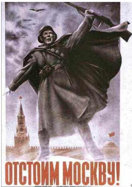
Slika 1: Sovjetski plakat pravi: »Branite Moskvo«

Položaj ruskih čet je bil v tistem trenutku izredno resen. Sovjetska vlada, diplomatski zbor in vse industrijske panoge, ki so bile zmožne pomagati, so se preselile v Kujbišev, dobrih 800 kilometrov vzhodno od prestolnice. Tam je potekala reorganizacija vojske za veliko protiofenzivo, ki jo je načrtoval Stalin. Devetnajstega oktobra je Stalin razglasil v Moskvi obsedeno stanje in izdal dnevno povelje: »Moskvo bomo branili do zadnjega.«