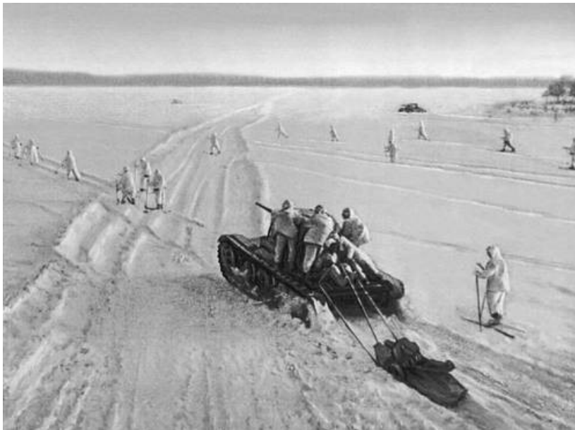
Slika 6: Sovjetska protiofenziva