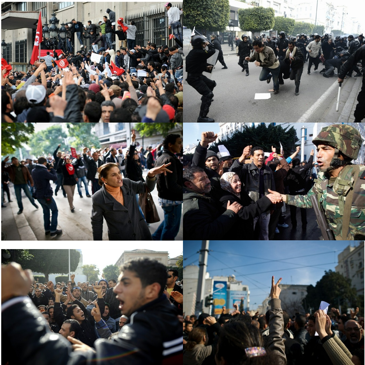
Protesti v Tuniziji v sliki

Jeseni 2011 so v Tuniziji že potekale volitve na katerih je zmagala stranka zmernih islamistov, imenovana Enahda. Decembra 2011 pa so potekale tudi predsedniške volitve na katerih je zmagal nekdanji vodja opozicije.