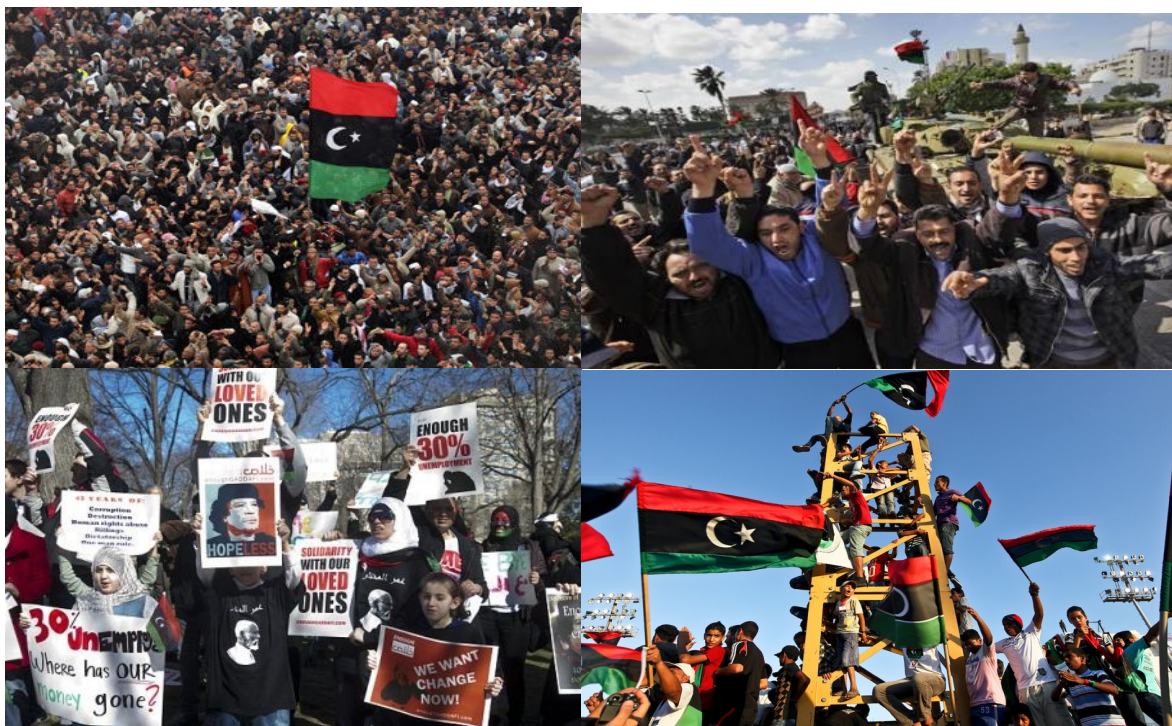
Protesti v Libiji v sliki