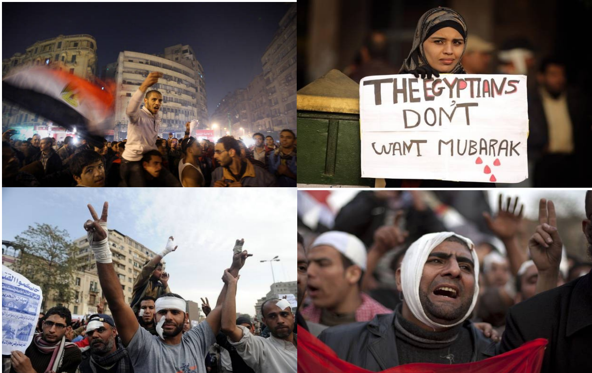
Protesti v Egiptu v sliki

Jeseni, tik pred parlamentarnimi volitvami, ki naj bi pomenile prehod države v demokracijo, so v Egiptu znova izbruhnili protesti, tokrat proti vojski. Demonstranti so zahtevali, da se vojska umakne in oblast prepusti civilnim oblastem, a sta vojska proti njim surovo nastopili.