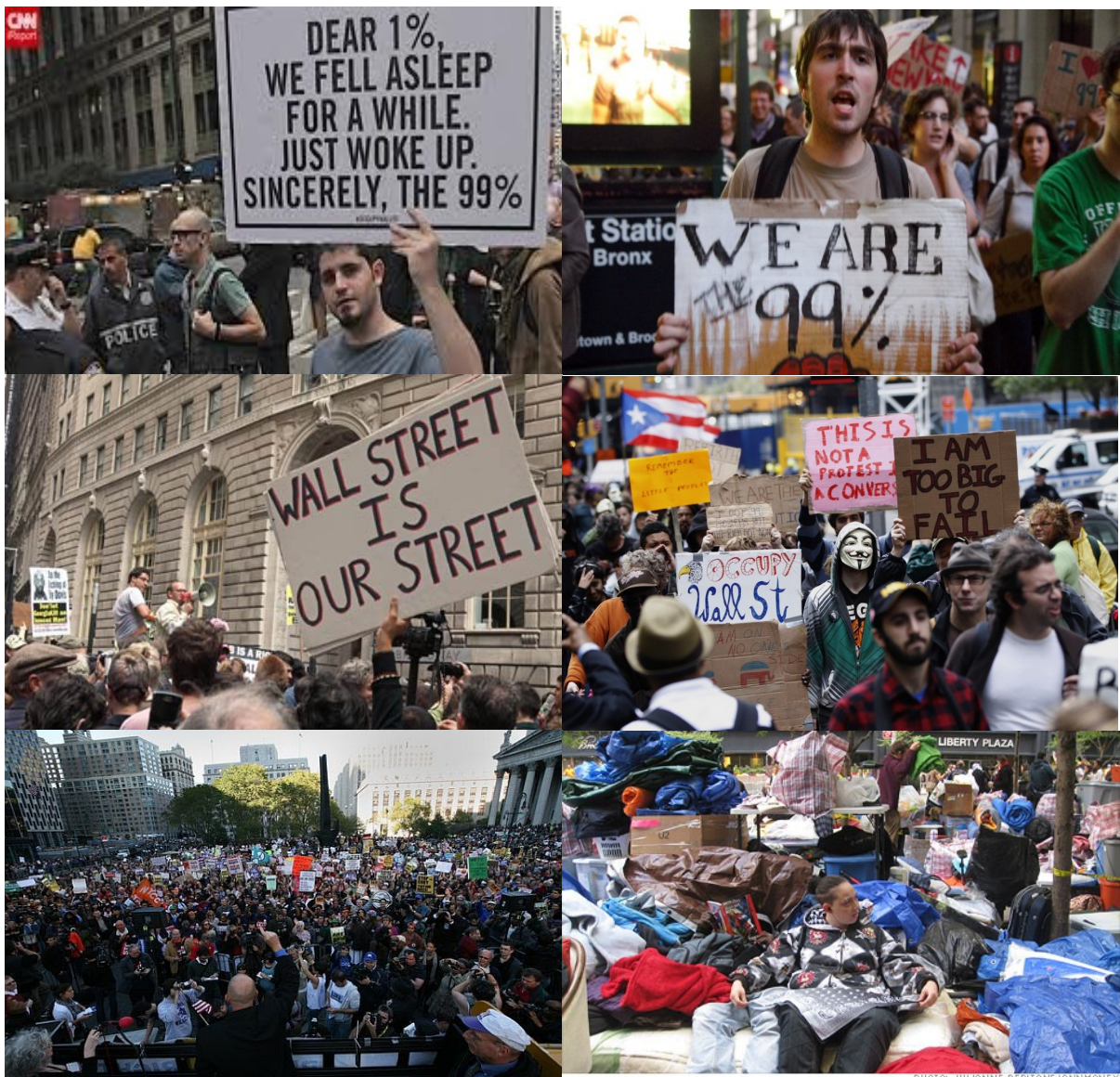
Protesti za smrt izkoriščevalskega kapitalizma v sliki

Protesti so bili namenjeni izražanju nestrinjanja s politiko zategovanja pasu pri tistih, ki ga imajo že najbolj zatisnjena. Uprli so se oblastem, ki delajo v korist peščice ljudi. S protesti so se uprli tudi finančnemu kapitalizmu, češ da razlašča skupno bogastvo in ga pretaka v žep enega odstotka najbogatejših ljudi, uprli so se bankam, borzam, finančnim trgov, tajkunom, izkoriščevalskim gospodarjem, političnemu razredu... Zahtevali so, da izobrazba, zdravje, stanovanje, okolje, dohodek, mobilnost ... postanejo brezpogojna pravica, del vsem dostopne blaginje.