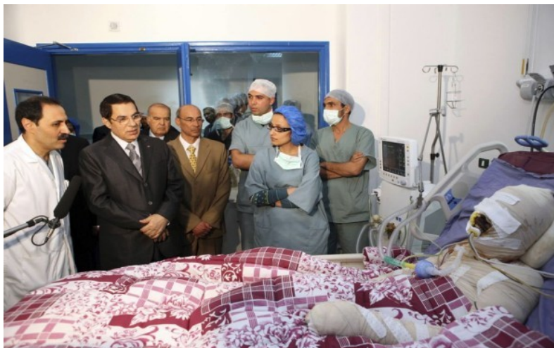
Mohamed Buazizi v bolnišnici

Dogodek, ki je sprožil ljudski upor v Tuniziji se je zgodil 17. decembra 2010, ko se je v znamenje protesta proti oblastem in obupa nad življenjskimi razmerami v državi zažgal 26-letni Mohamed Buazizi, ki so mu tamkajšnje oblasti zaradi nezmožnosti plačila podkupnine zaplenile edini vir preživljanja - voziček s sadjem in zelenjavo.