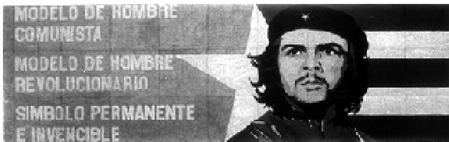
Slika 3: Che Guevara