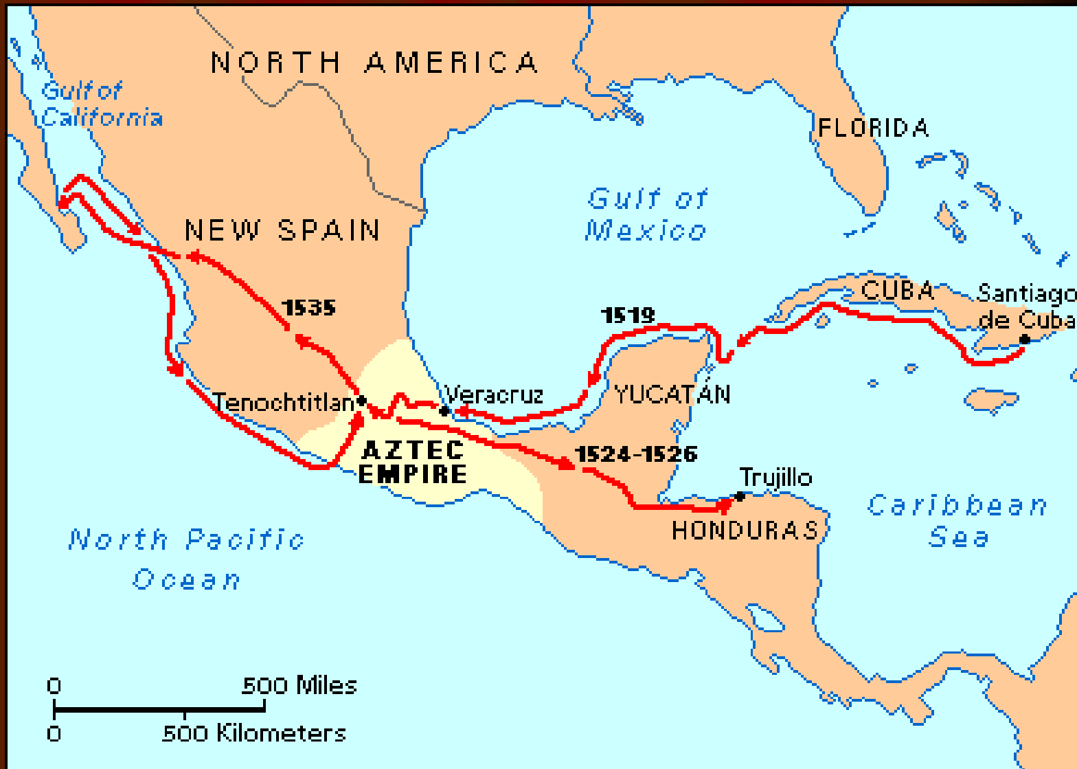
Cortezova pot v Mehiko