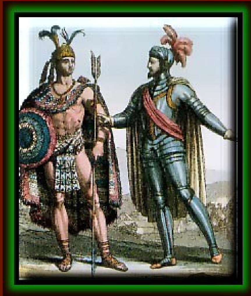
Cortez in kralj Montezum