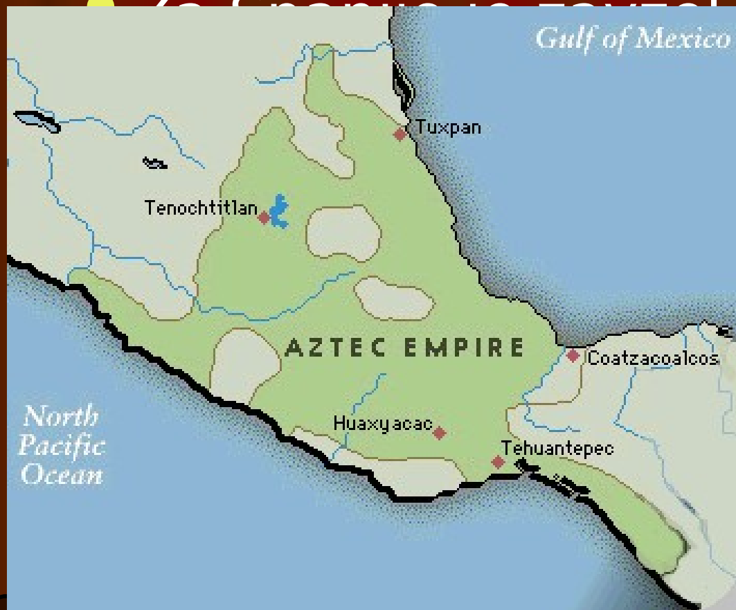
Zemljevid Azteške države pred prihodom Corteza