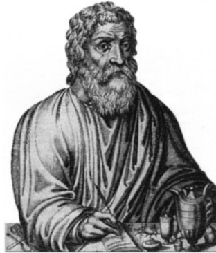
Slika 9: Hipokrat

vodovode in kopališča. Cezar je zelo cenil dobre zdravnike, tem pa je podelil tudi posebne pravice in dovoljenja (lahko tudi rimsko državljanstvo).