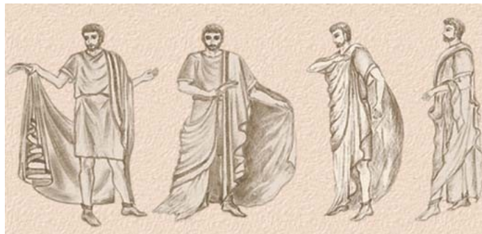
Slika 6: Rimljan, ki si oblači togo

Rimljani so se oblačili preprosto. Moški so nosili preproste tunike, ki so se gale do kolen, ko so odšli od doma pa so si nadeli še togo 4 . Ženske so nosile raznobarna oblačila iz različnih materialov, osnovno oblačilo pa je bila tunika, ki je segala do tal. Ko so ženske odšle od doma, so si oblekle še palo (ogrinjalo podobno tuniki). Rimljani so po mestu hodili v usnjenih čevljih, doma pa v sandalih. Sužnji so ponavadi hodili bos.