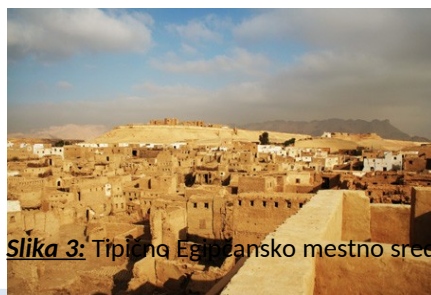
Slika 3: Tipično Egipčansko mestno središče

Množice delavcev in sužnji, ki so opravljala dela po faraonovem naročilu so živeli v barakah, ki so bile zgrajene na hitro. Bile so zelo skromne in opremljene z le nekaj posode ter nekaj kož, za spanje in sedenje, na ilovnatih tleh.