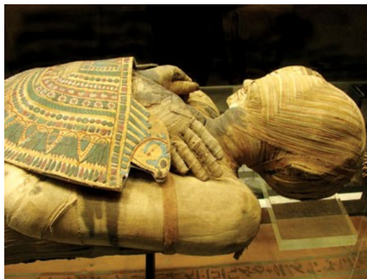
Slika 8: Egipčanska mumija