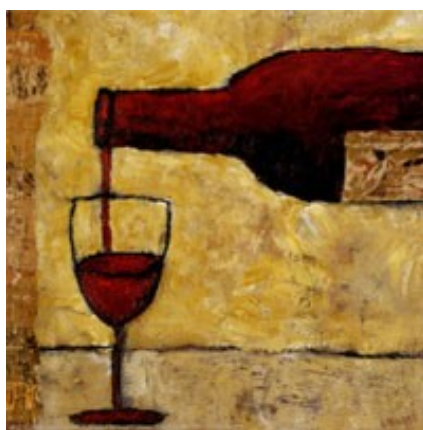
Slika 5: Glavna pijača Rimljanov je bilo vino