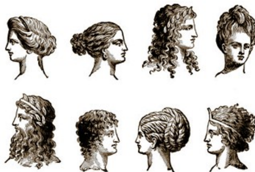
Slika 7: Različne vrste pričesk, žensk v Grčiji

Tudi pri Rimljanih je bila osebna higiena zelo pomembna. Hišna stranišča so si lahko privoščili samo premožnejši, ostali so uporabljali javna stranišča. V javnih straniščih so tudi posedali in klepetali. Oblačila so enostavno splaknili v reki. Moški so raje nosili krajše lase, zaradi zahtevnega vzdrževanja las in uši, mlajše ženske so si lase spenjale v figo, starejše ženske pa so imele umetelno oblikovane pričeske. Lase so si tudi barvale in kodrale.